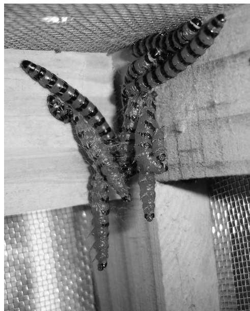
Figura 3: Larvas de C. doddi con signos de enfermedad movilizándose por el techo de la jaula.