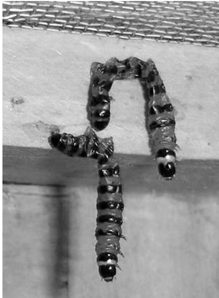
Figura 2: Larvas de C. doddi colgadas de sus espuripedios.