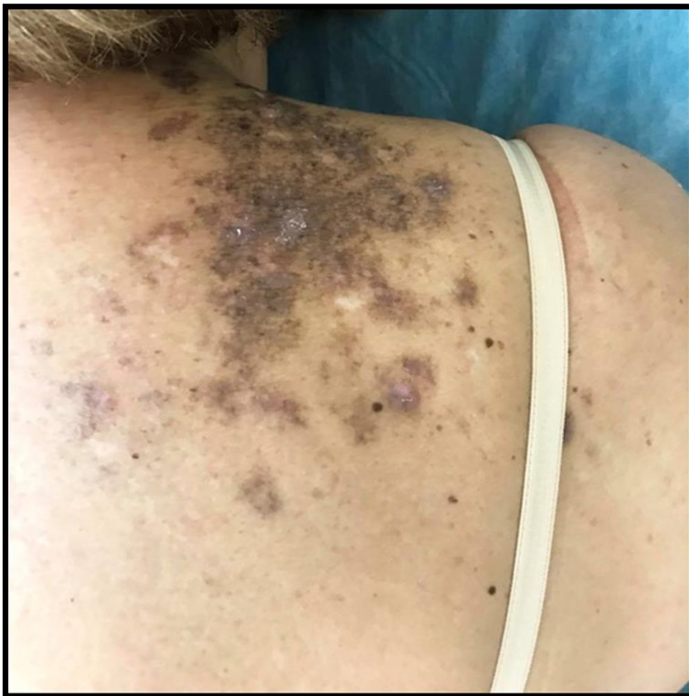
Figura 3: Luego de 30 sesiones de fototerapia: placas color castaño. A la palpación notamos disminución de la infiltración de las lesiones.