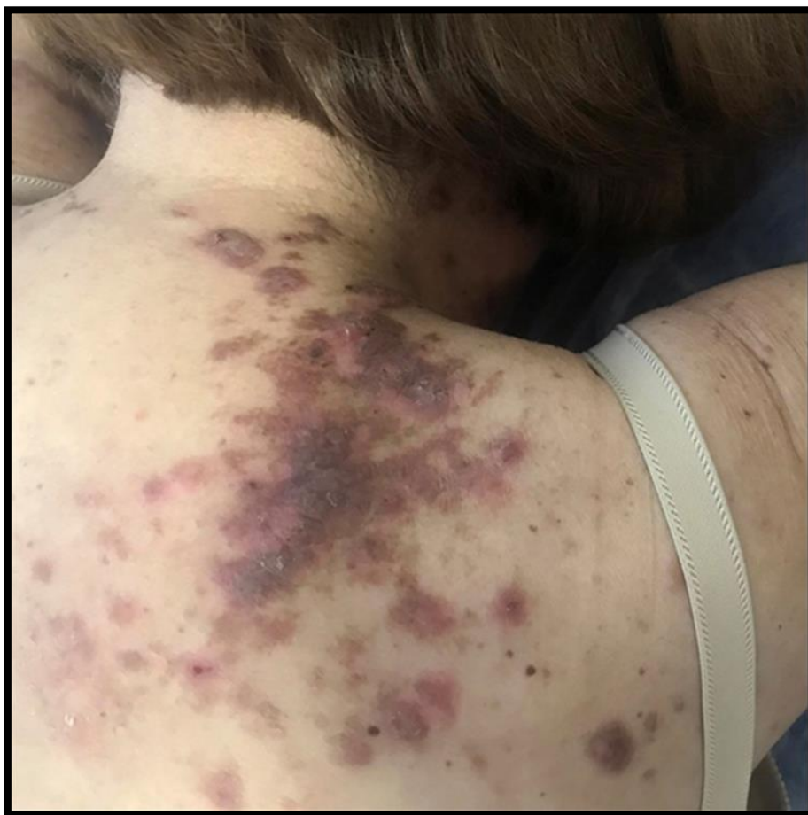
Figura 1: Primera consulta. Placas infiltradas eritematovioláceas y otras hiperocrómicas en nuca, región vertebral (cervical y dorsal), región posterior del hombro, región interescapular, y región escapular (supraespinosa e infraespinosa).

Consultó por una dermatosis pruriginosa de nueve meses de evolución, que apareció un mes después del inicio de imatinib. Previamente había sido tratada con clobetasol local y antihistamínicos sin respuesta. Al examen físico, se constataron múltiples placas infiltradas eritematovioláceas pruriginosas en dorso, extremidades y axilas. No presentaba lesiones en mucosas y anexos ( Figura 1 ).