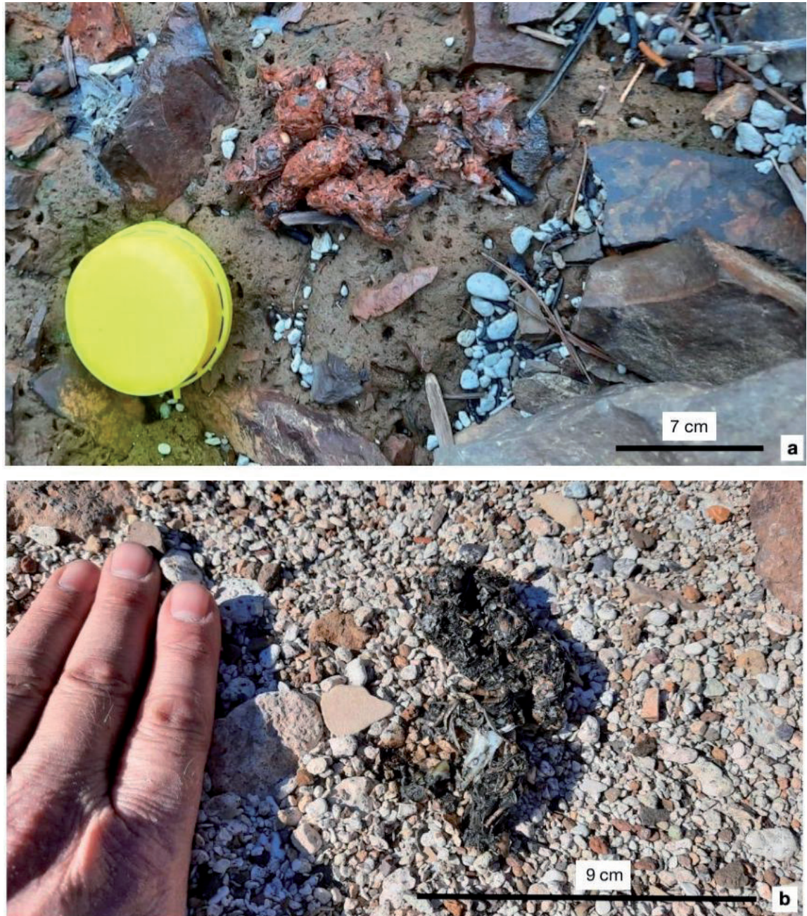
Figura 3. Heces de huillín ( Lontra provocax ) encontradas en las costas del embalse Alicurá. a) Heces de huillín encontradas en el punto 6, muy frescas, en la que predominaban los restos de crustáceos. Escala= 7 cm; b) heces de huillín encontradas en el punto 4, semifrescas, con restos de pescado (pueden identificarse vértebras y fragmentos de esqueleto con facilidad) y crustáceos. Escala= 9 cm. Figure 3. Southern river otter ( Lontra provocax ) feces, found in the Alicura reservoir. a) Fresh feces found in site 6, in which remains of crustaceans predominated. Scale= 7 cm; b) semi-fresh feces found in site 4, with evident remains of fish (vertebrates and skeleton fragments) and crustaceans. Scale= 9 cm.