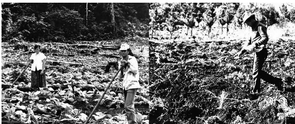
Figura 4 – Agricultores del frente pionero, departamento San Pedro (Misiones, Argentina).

También en el frente pionero de Misiones, indagando acerca de las técnicas de horticultura en una aldea mbya guaraní, vecina del asentamiento agrícola del que provienen los ejemplos anteriores, la materialidad de la transferencia de significados en el trabajo de campo emergió del carácter indexical de la observación. En esa oportunidad, mi recorrido de campo coincidió con la fecha de San Juan (23 de junio) y la conjunción con este factor contextual me franqueó el acceso a ciertas prácticas. Fue en esa ocasión que comprendí la razón de la denominación de ciertas especies como xanjau (adaptación al guaraní del portugués São João), ya que el día de San Juan se cultivan como prueba varias plantas cuyo ciclo se inicia más tarde (“hacemos una probación, y si da bien, plantamos después, cuando ya es el momento”). Así, la sandía, que se cultiva en septiembre, tiene esa denominación porque se hace una prueba el día de San Juan.