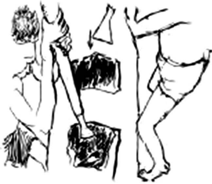
Figura 3 – Descripción de gestos en la operación de ahuecamiento de un tronco para la construcción de una canoa entre los Vevo de Madagascar. Figura de la derecha: percusión lanzada vertical longitudinal. Figura de la izquierda: movimiento de vaivén transversal en el plan de la percusión vertical.