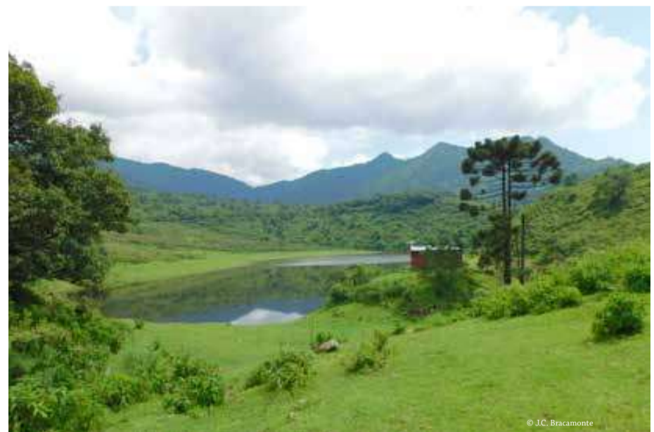
Laguna Comedero, Yala .

Acceder a información adicional en la web de la RELCOM