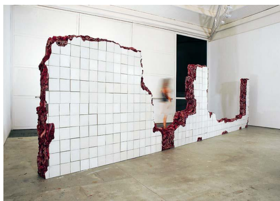
FIGURA 7 (ESQUERDA): Linda do Rosário, 2004 óleo sobre alumínio e poliuretano, 195 x 800 x 25 cm

luxúria. Nos encontramos em uma zona semântica que reafirma a ideia do informe como constitutiva do barroco. Esta conexão questiona, como quero propor, uma forma de pensar o desenvolvimento histórico do barroco no Brasil, a de um “barroco oficial”. Vou me deter em certas obras que funcionam como pistas e chaves para uma leitura nesta direção. Em Linda do Rosário (2004), que faz parte da série Charques , Varejão produz uma peça que reproduz uma parede derrubada, coberta de azulejos brancos. Segundo a artista, a obra foi inspirada por um desabamento no hotel Linda do Rosário em 2002, quando as paredes caíram sobre um casal enquanto dormia. O que é notável sobre Linda do Rosário , mais do que a possível metáfora sexual, é o contraste entre a superfície branca dos azulejos e seu conteúdo carnal, o que só um desabamento deixa observar. Duas outras obras – também parte da mesma série, Ruína modernista I (2018) e Ruína modernista II (2018) –, seguem o mesmo critério, e embora neste caso as superfícies não estejam cobertas com azulejos brancos, o título escolhido é significativo. Por que falar de ruína modernista?