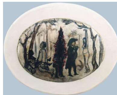
FIGURA 3 (DIREITA): Filho bastardo, 1992 óleo sobre madeira, 110 x 140 x 10 cm.

Em Filho Bastardo II , a cena é semelhante. A figura masculina de Jantar é mostrada estuprando uma escrava, e à esquerda, dois homens militares conversam enquanto prendem uma indígena encadeada, que espera em uma cama. Desta forma, ao comerciante e ao funcionário público que apareceram nas aquarelas originais, Varejão acrescenta a instituição militar e a instituição eclesiástica, exibindo um dispositivo colonial-patriarcal baseado na subjugação das mulheres. Agora podemos ser mais precisos: a apropriação feita funciona como uma anamorfose das aquarelas de Debret. O que estava latente nestas últimas torna-se uma imagem explícita e original para nos informar que o projeto colonizador e imperial estava baseado no estupro sistemático da escrava negra e da mulher indígena. Aqui não há sensualidade possível, não há transgressão. A comunidade organizada entre brancos, negros e indígenas é reformulada para mostrar sua verdadeira hierarquia, que incluía o poder da morte e do domínio sobre os corpos.