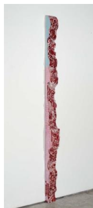
FIGURA 8 (CENTRO): Ruína Modernista I, 2018, óleo sobre alumínio e poliuretano, 12,5 x 239 x 16 cm.