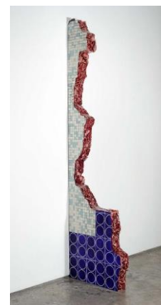
FIGURA 9 (DIREITA): Ruína Modernista II, 2018, óleo sobre alumínio e poliuretano, 12,5 x 254 x 67 cm