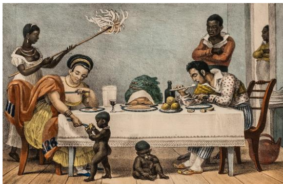
FIGURA 4 (ESQUERDA): Un dîner brésilien (um jantar brasileiro). 1827, Aquarela 15,9 x 21,9 cm. MEA 0199.

Em Filho Bastardo II , a cena é semelhante. A figura masculina de Jantar é mostrada estuprando uma escrava, e à esquerda, dois homens militares conversam enquanto prendem uma indígena encadeada, que espera em uma cama. Desta forma, ao comerciante e ao funcionário público que apareceram nas aquarelas originais, Varejão acrescenta a instituição militar e a instituição eclesiástica, exibindo um dispositivo colonial-patriarcal baseado na subjugação das mulheres. Agora podemos ser mais precisos: a apropriação feita funciona como uma anamorfose das aquarelas de Debret. O que estava latente nestas últimas torna-se uma imagem explícita e original para nos informar que o projeto colonizador e imperial estava baseado no estupro sistemático da escrava negra e da mulher indígena. Aqui não há sensualidade possível, não há transgressão. A comunidade organizada entre brancos, negros e indígenas é reformulada para mostrar sua verdadeira hierarquia, que incluía o poder da morte e do domínio sobre os corpos.