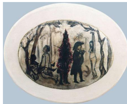
FIGURA 5 (DIREITA): Filho Bastardo II - Jantar Interior, 1995 óleo sobre madeira, 110 x 140 x 10 cm.