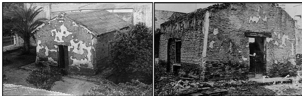
Figura 2. Fotos de la Capilla, vista este, sin datos de fecha y autor.

Las excavaciones comenzaron en el año 2010, en el marco del proyecto de investigación arqueológica del Museo Universitario FCEIA, UNRosario, como parte del Programa Apoyo a Proyectos de Investigación SECTI Provincia de Santa Fe y por Convenio entre la FCEIA a través del Museo y la Municipalidad de San Javier, representada por su Secretaria de Cultura (Cornero et al. 2002, y Cornero et al. 2010).