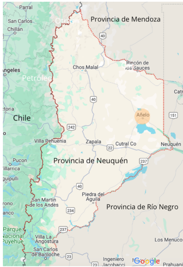
Figura 1. Ubicación de la localidad de Añelo, provincia de Neuquén, Argentina