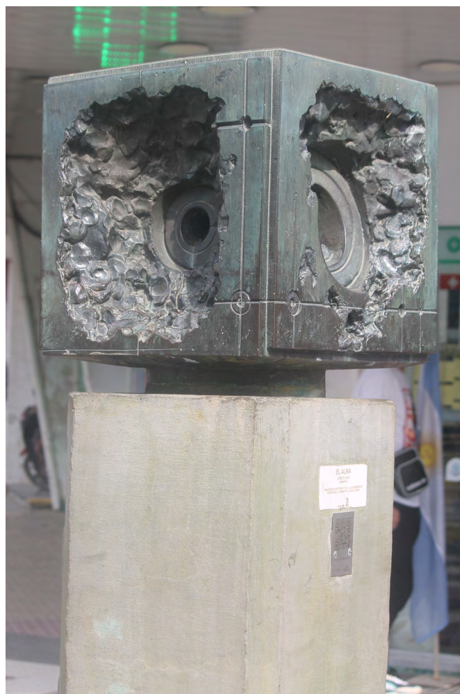
Líbero Badíi. El Alma . Bronce, 60 x 60 cm. Av. Alberdi y Juan Domingo Perón, Resistencia, Chaco. Emplazada en 1962. Foto: Andrea Geat, 2022.

La obra dialoga a su vez con otras piezas escultóricas basadas en conceptos como el tiempo, la gloria, también bocetadas en la puerta del Fogón y tituladas La familia , La mujer , El hombre y la mujer , realizadas entre 1960 y 1965. Hay, a su vez, un diálogo evidente con la escultura Ave Fénix , adquirida por el Centro Kennedy de