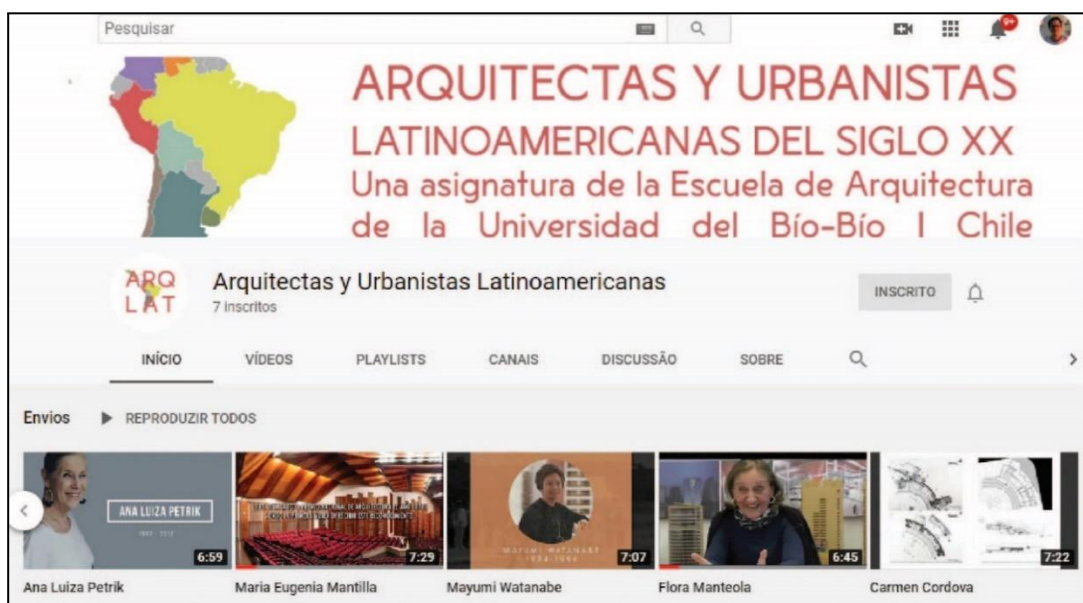
Fig. 5 Pantallazo del canal de YouTube que demuestra los resultados de la asignatura a través de los trabajos de los alumnos.

De esta manera y considerando las generaciones de alumnos inscriptos y el núcleo de estudio que persigue el dictado de la asignatura en el ámbito del pregrado, su instalación dentro de una malla pedagógica eficaz confirma que se ha posicionado como uno de los mecanismos más efectivos para diluir la mentada invisibilización de la mujer en la profesión. Y, aunque el movimiento estudiantil provocado en un 2018 ya distante, en el cual se aspiró quebrar el tradicional discurso hegemónico occidental y patriarcal, esperan por una resolución más global (Gallegos; 2020, p. 256), este caso intenta y ofrece alivio a las disputas de la legitimación en el ámbito disciplinar para y con la mujer.