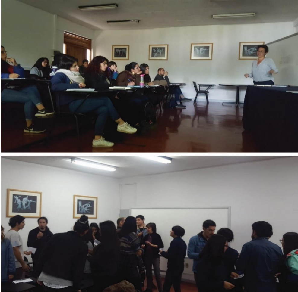
Fig. 2: Clase teórica y dinámica de investigación.

publicaciones especializadas revisando proyectos e incluso contactar investigadores y periodistas de otros países y, en el mejor de los casos, obtener un contacto directo con la profesional estudiada. (Fig. 2)