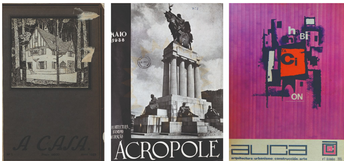
Figura 1: De izquierda a la derecha primeras portadas de las revistas A Casa (1923), Acrópole (1938) y AUCA (1965)