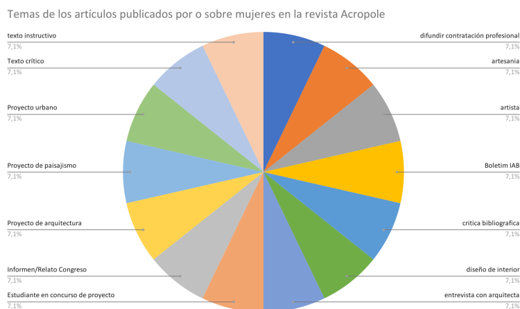
Tabla 2: Temas de los artículos publicados por o sobre mujeres en la revista Acrópole