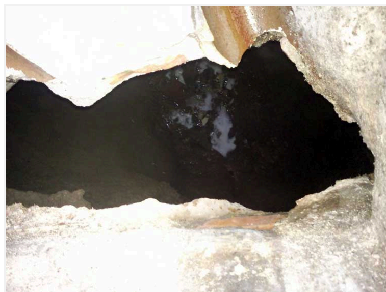
Vista del agua en el fondo del derrumbe (profundidad aproximada 3.50 metros)