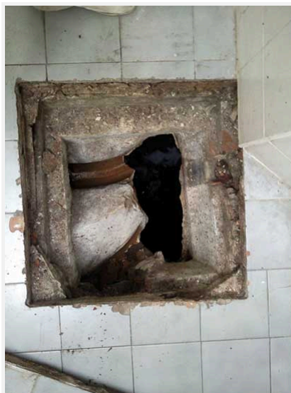
Vista de la rotura del fondo de la cámara, el agua cae al fondo del derrumbe inferior.