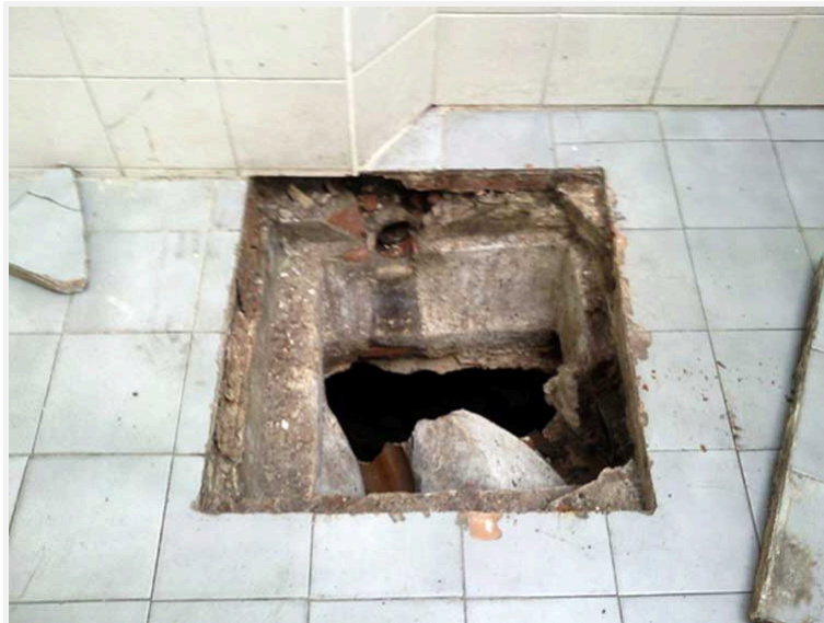
Cámara de inspección en la que confluyen los diferentes cloacales y pluviales.