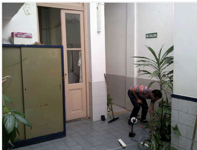
El patio en la actualidad sin evidencia alguna de la situación bajo el piso.