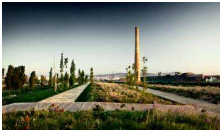
Fig. N° 5: Parque río Llobregat, Barcelona

Los caminos de ribera, cuyo diseño alude al pasado histórico del río como itinerario Romano, son los ejes estructuradores de la intervención ambiental y paisajística, que se completa con estrategias de pequeña escala a nivel hidráulico y paisajístico. Entre las hidráulicas están las balsas de retención y conducción de las aguas, los taludes e islas artificiales y una serie de “deflectores” que permiten estimular la tendencia del río a generar meandros (A.A.V.V., 2012). Entre las estrategias paisajísticas se destacan el parque lúdico fluvial ubicado en el tramo final del Llobregat, que actúa como la puerta principal al río desde el tejido urbano y un sistema de pasarelas y miradores vinculados a los núcleos urbanos y a los caminos de sirga.