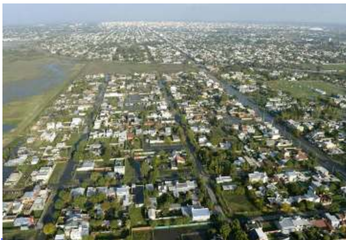
Fig. N° 3: Imagen aérea de la ciudad de La Plata tomada el 2 de abril de 2013