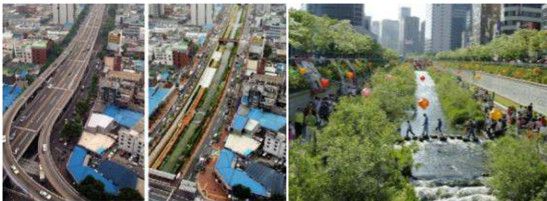
Fig. N° 10: Arroyo Cheonggyecheon, Seúl