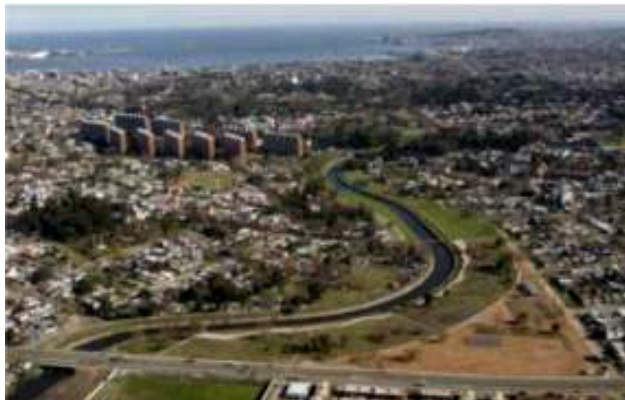
Fig. N° 7: Parque Lineal del arroyo Miguelete, Montevideo

Fuente: http://www.laciudadviva.org/opencms/export/sites/laciudadviva/04_experiencias/cvot/arroyomiguelete/CVOT04_PARQUE_LINEAL_ARROYO_MIGUELETE.pdf