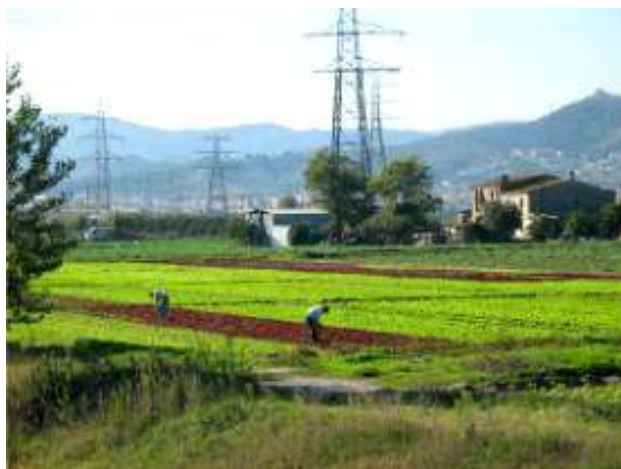
Fig. N° 6: Parque agrícola del bajo Llobregat, Barcelona