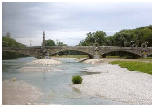
Fig. N° 8: Renaturalización del Río Isar

El plan Isar, impulsado por organizaciones ciudadanas, previó el ensanchamiento del río, alcanzando el doble de su ancho anterior, permitiendo el rebalse de las aguas y dando lugar a márgenes de grava que se reorganizan luego de cada crecida. Además la presencia de islas, pastizales y bosques ribereños de especies autóctonas contribuyen a mejorar la calidad ecológica y favorecer el desarrollo de actividades de esparcimiento.