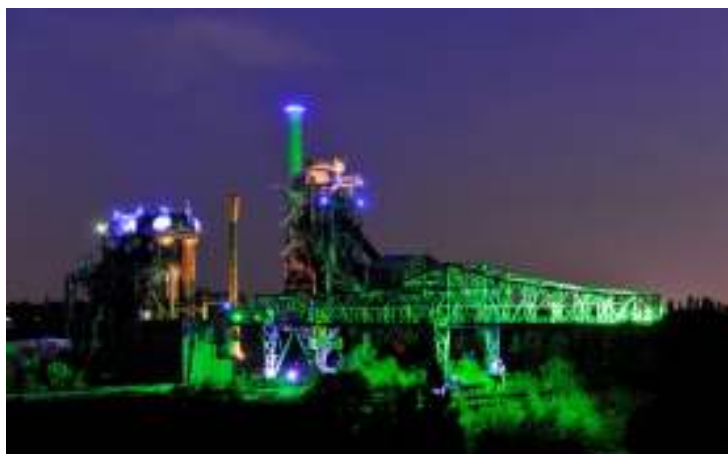
Fig. N° 4: Emscher Park, Alemania