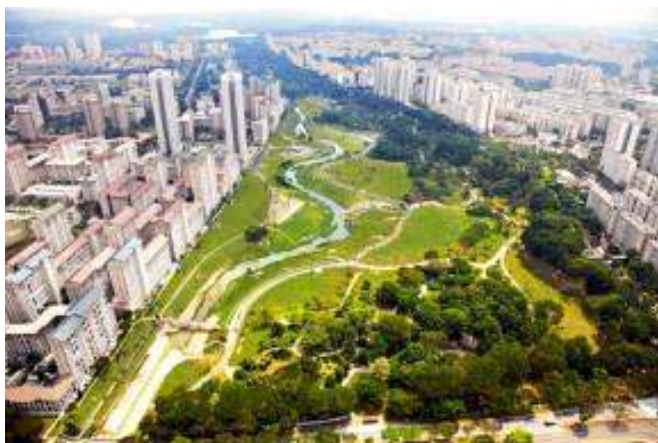
Fig. N° 9: Bishan Park, Singapur