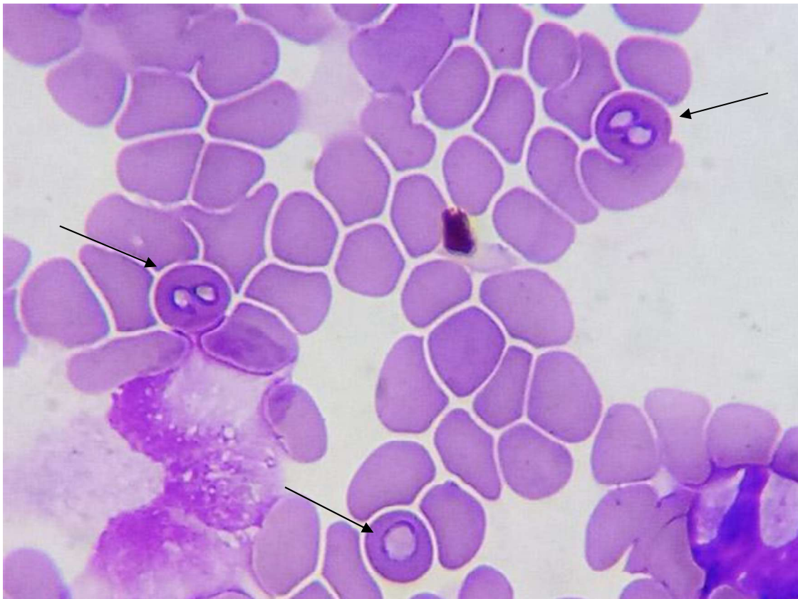
Figura 1. Zoítos de “piroplasmas grandes” ( > 2,5 \mu\text{m} ) en un extendido coloreado de sangre canina (Objetivo 100 X); cortesía de Franco José Arroyo.

Actualmente, se reportan varias especies de piroplasmas que pueden afectar perros y gatos en todo el mundo. Para realizar una distinción morfológica, tradicionalmente se clasificó los piroplasmas en base al tamaño de los zoítos intraeritrocitarios. Algunos ejemplos de piroplasmas grandes ( > 2,5 \mu\text{m} ) son los zoítos pertenecientes a B. vogeli y R. vitalii (Fig. 1). En el caso de los piroplasmas pequeños ( < 2,5 \mu\text{m} ) podemos mencionar las inclusiones de B. gibsoni , B. felis y Cytauxzoon felis (Irwin, 2009; Ayoob et al., 2010; Solano-Gallego y Baneth, 2011; Solano-Gallego et al., 2016). También se han descrito piroplasmas cuyos merozoítos poseen un tamaño intermedio como Babesia negevi n. sp. (Baneth et al., 2020).