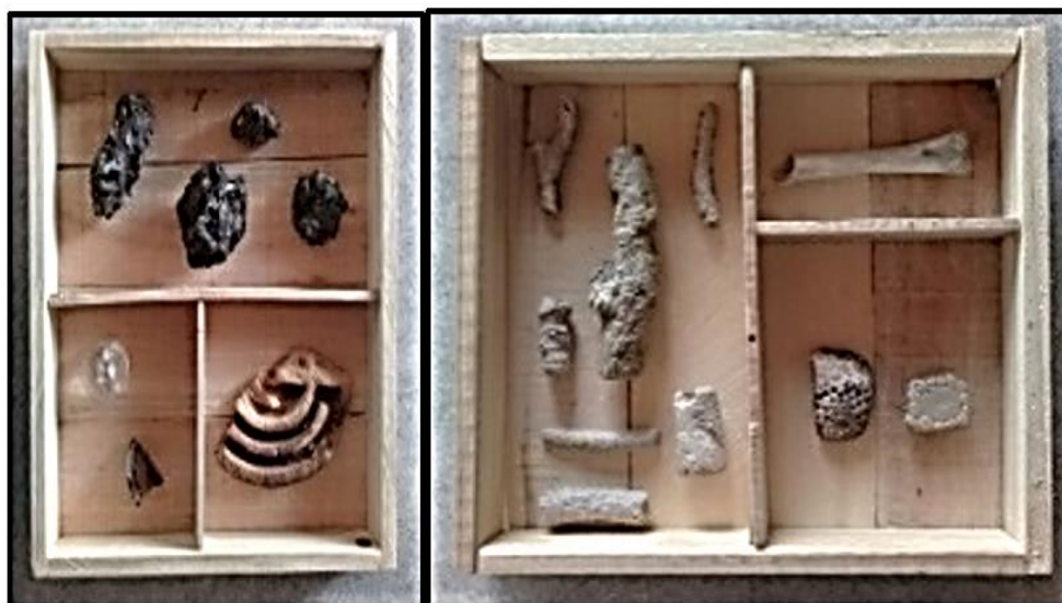
Figura 8: Cajas pedagógicas con los objetos y fragmento de caparazón de gliptodonte

de piezas industriales, minerales, etc). El artista trajo materiales, principalmente industriales, para analizar la convivencia del hombre en la costa, con el fin de ver cómo impacta en ese ecosistema. En ese trabajo de juntar piedras, se encuentra con fragmentos de gliptodonte, por lo que hizo dos cajas como módulos didácticos (Figura 8) para que sean utilizados como material pedagógico en la visita de alumnos tanto en el Museo como en la oficina de Guardaparques de la Reserva. Uno de los módulos tiene que ver con la relación del hombre, el polo petroquímico y el impacto en ese lugar. El otro módulo, se vincula con lo más agreste, con lo natural. Resulta ser que esas piezas de gliptodonte tienen que ver con el dragado que se hizo en el Canal Principal para el acceso de grandes barcos (año 2013), es así que se reactiva el tema de la agresión e impacto del hombre en ese lugar.