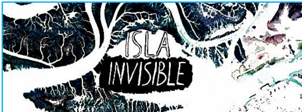
Figura 6: Logo del proyecto Isla Invisible