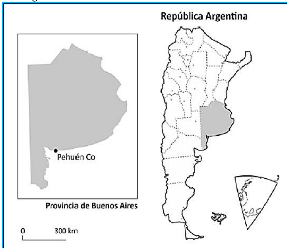
Figura 2: Localización de la localidad de Pehuen Có

Pehuen Có es un balneario localizado en el sudoeste de la provincia de Buenos Aires (Argentina), sobre la costa atlántica. Pertenece al partido de Coronel de Marina Leonardo Rosales, situándose a 68 km de Punta Alta (ciudad cabecera del partido) y a 85 km de Bahía Blanca. El ingreso a la villa se realiza por la Ruta Provincial N°113/2, la cual conecta con la Ruta Nacional N°3 (Figura 2).