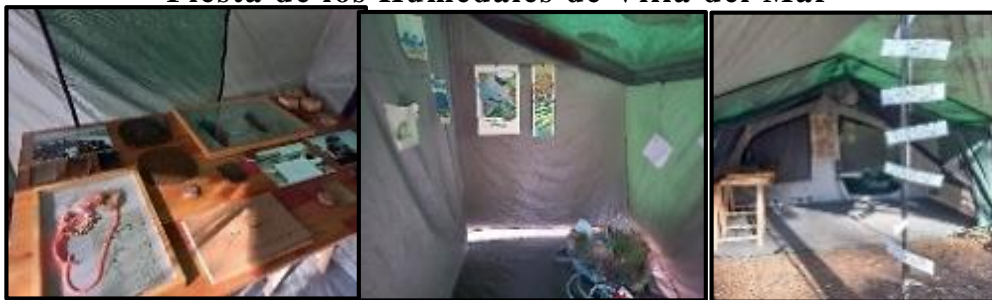
Figura 7: Muestra de la residencia a Isla Bermejo, en la Fiesta de los Humedales de Villa del Mar

A partir de esta experiencia en las islas, se llevan a cabo exposiciones, se edita el material de difusión y se participa en distintos espacios de sociabilización (artísticos, educativos, académicos, eventos) (Figura 7). De esta manera, se logra difundir no solo el trabajo realizado por los participantes de las residencias sino también dar a conocer lo que existe más allá del puerto local.