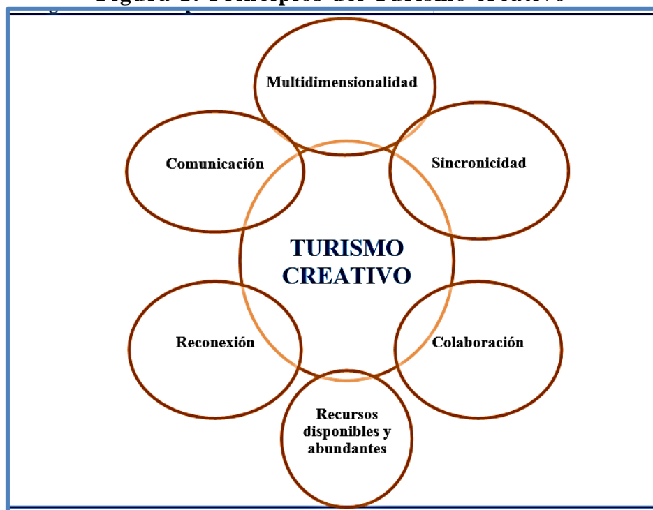
Figura 1: Principios del Turismo creativo