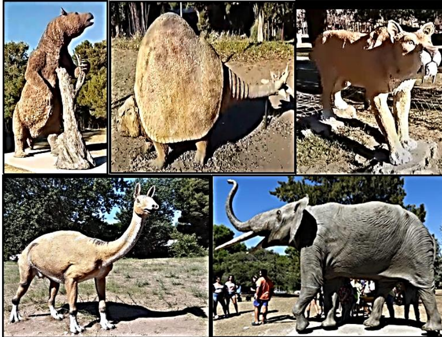
Figura 5: Réplicas de animales extintos ubicados en el parque temático

(FUNDASUR), del Municipio de Coronel Rosales y de la Cámara de Diputados de la Provincia de Buenos Aires.