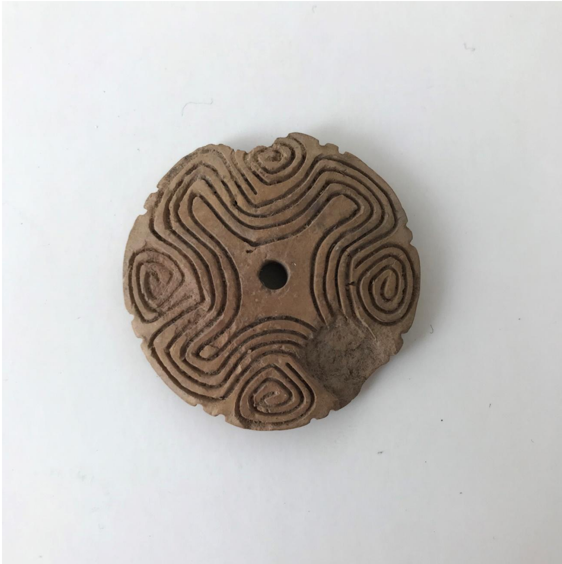
Figura 2. Pap.