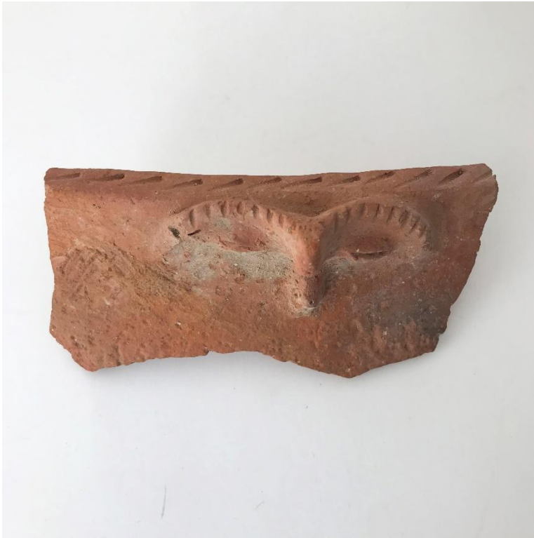
Figura 5. Pap.