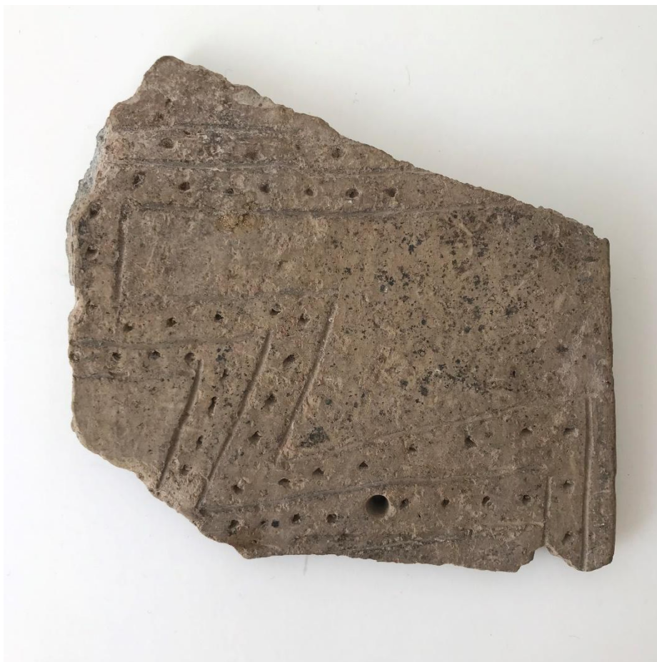
Figura 7. Pap .