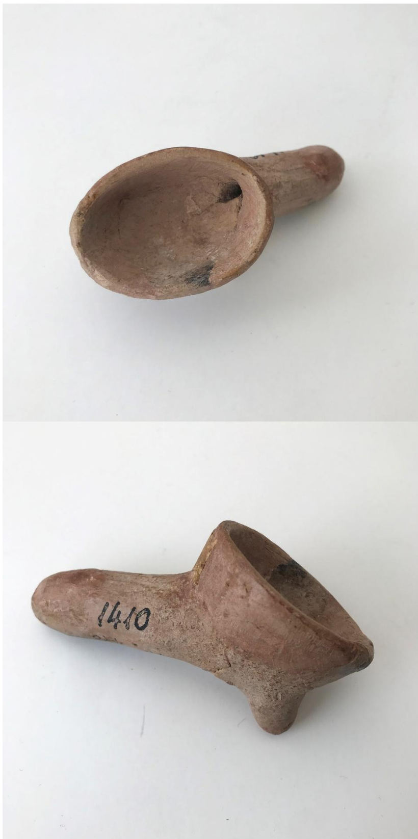
Figuras. 3 y 4. Pap.