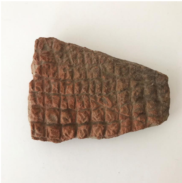
Figura 6. Pap.