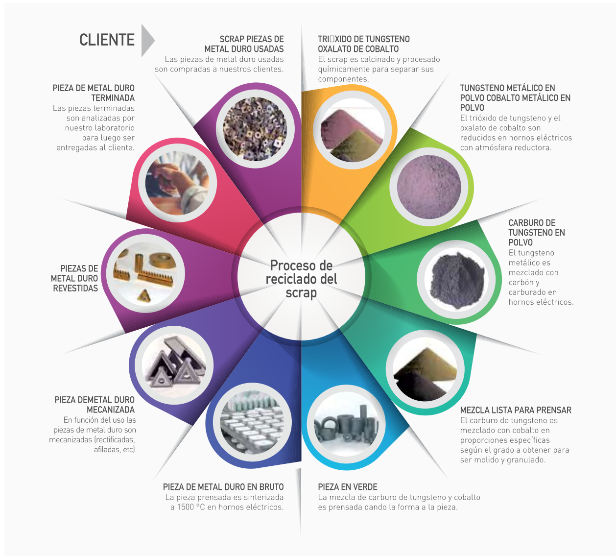
Imagen 2 Reciclado de Scrap