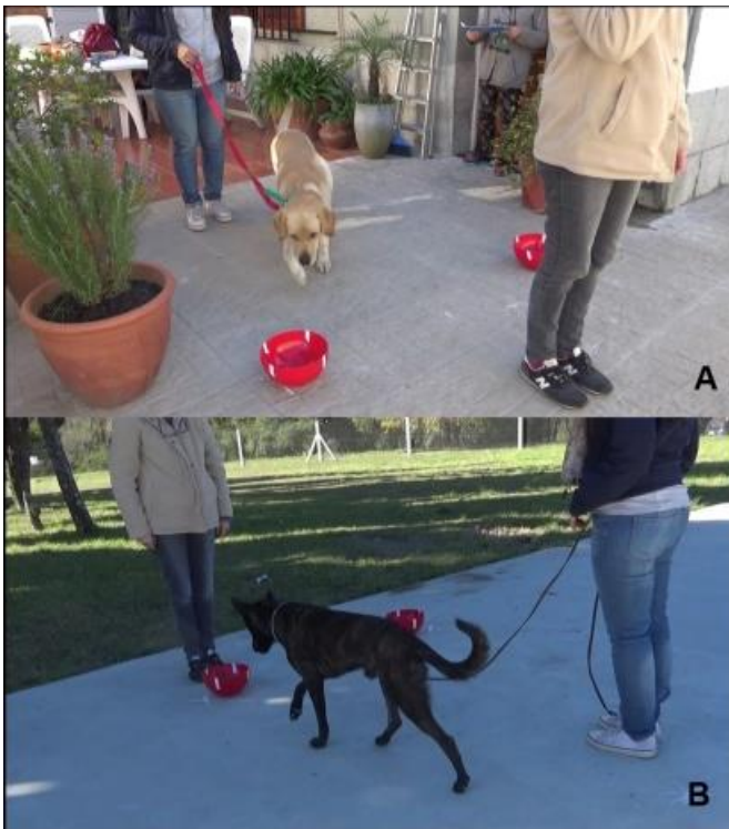
Imagen de la situación experimental de la tarea no social (A) y de la social (B)