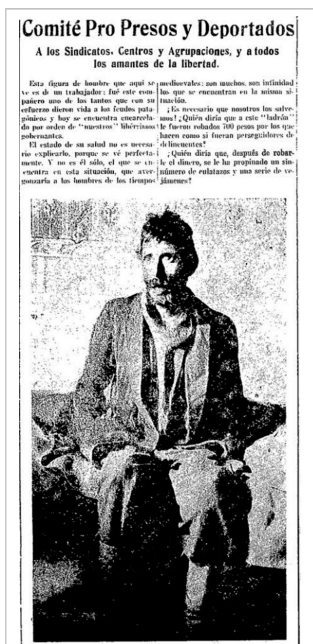
Figura 4. Información e imagen

Luego de terminada la huelga, La Protesta continuó publicando cartas de los huelguistas presos en las que denunciaban las duras condiciones de su encarcelamiento, así como los numerosos vejámenes, torturas y trabajos forzados a los que eran sometidos ( La Protesta , 24/04/1922). Otro tema denunciado con vehemencia por La Protesta fue el robo de ropas, dinero y otros elementos de los prisioneros por parte de la policía, la gendarmería y los soldados ( La Protesta , 20/05/1922) 20 [Figura 4].