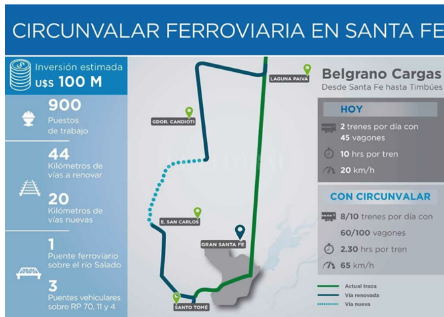
Figura 2. Circunvalación ferroviaria