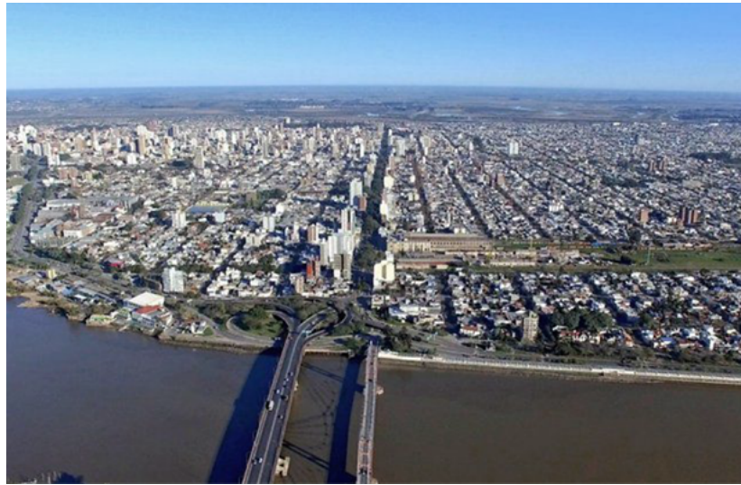
Figura 5. Construcción de torres en las inmediaciones de la ex estación Belgrano