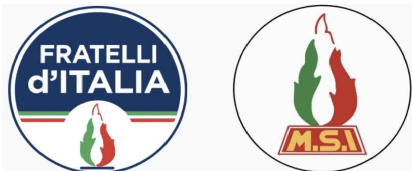
Figura 1: Logos partidarios del actual FDI y del extinto MSI, en donde se vislumbra la llama tricolor fascista.