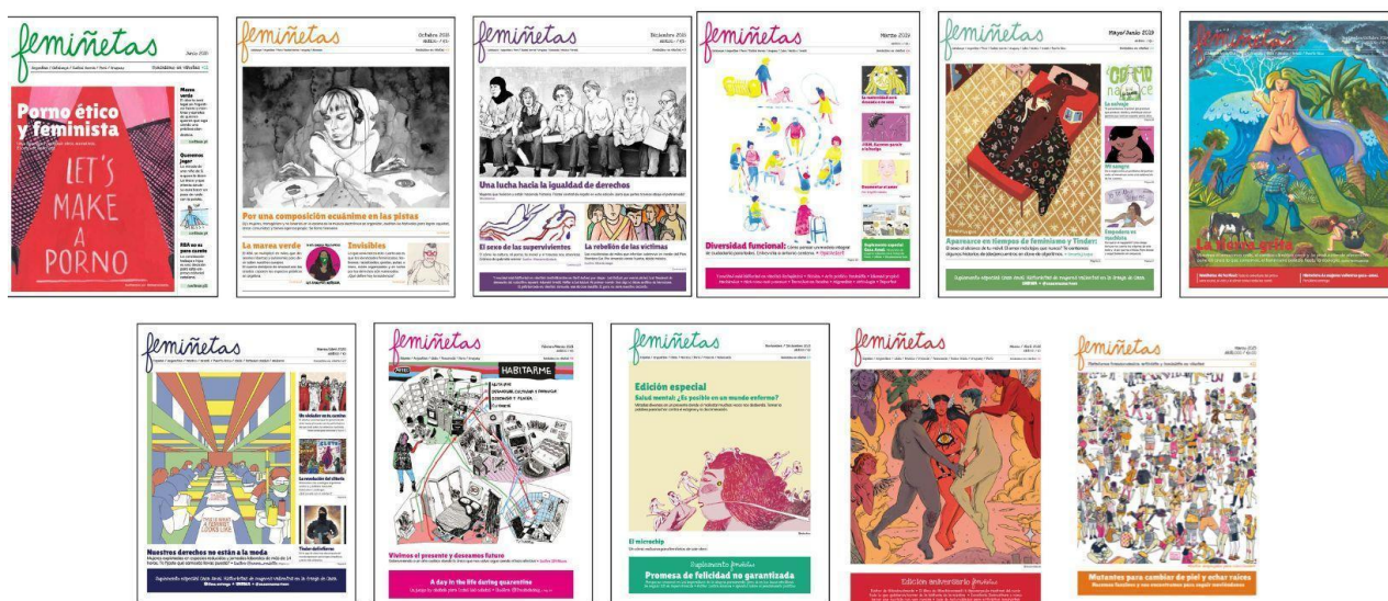
FIG. 5. Portadas de los once primeros números de femiñetas .

Femiñetas es la única publicación de las abordadas en este artículo que tiene publicidad y contó también con apoyo del Ministerio de Cultura de la Nación Argentina, a través del programa Gestionar Futuro, para financiar la décima edición del periódico. El último número, del 11 de marzo de 2023, mutó a fanzine como un pliego doble A3 a color y su bajada cambió a «Plataforma transoceánica artivista y feminista en viñetas».