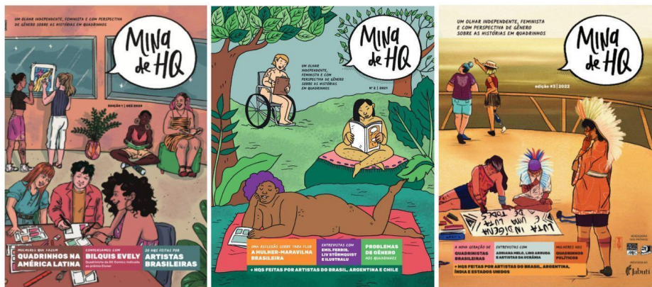
FIG. 6. Portadas de Mina de HQ .