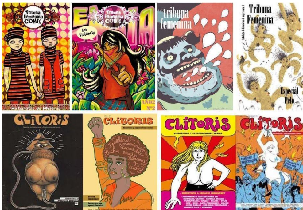
FIG. 1. De arriba abajo y de izquierda a derecha: Tribuna Femenina Comix (2009–2014), números del 1 al 4; Revista Clitoris (2011–2013), números del 1 al 4.