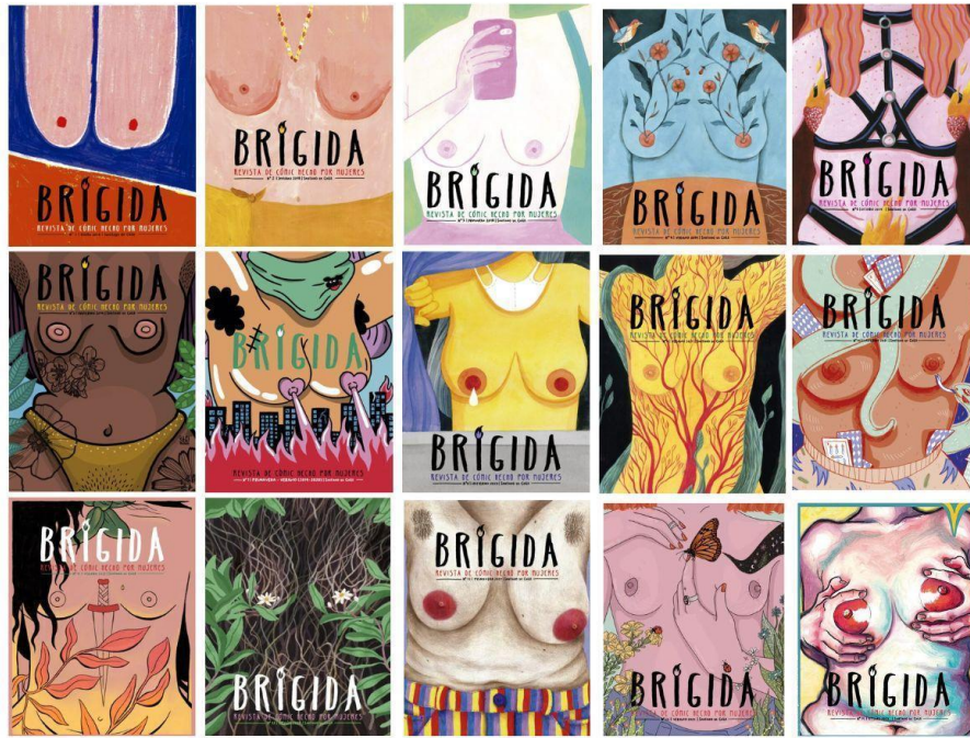
FIG. 4. Portadas de Brígida de los números 1 al 15.

En su primer editorial, «No estás sola, Julie», que homenajea a la historietista canadiense Julie Doucet, Molina señala que existía «un gran y diverso grupo de mujeres que nos movíamos en torno a la historieta durante la última década en distintos circuitos y que buscábamos generar nuestros propios espacios de producción y difusión» 33 . El cuarto número, motivado por el viaje al Festival de Historietas de Angoulême (Francia), se presentó un número especial silente (n.º 4, verano de 2019) y el editorial se tituló «Brígida: sin palabras, pero con mucho que decir» (traducido al inglés y al francés). Brígida se posiciona tanto en el campo de la historieta como en el de la política. La revista ha ido documentando los movimientos que han sacudido a la sociedad chilena. En ese sentido, apostaron a realizar tres números temáticos dedicados a distintas situaciones como el estallido social (n.º 7, primavera/verano de 2019/2020), la pandemia de Covid-19 (n.º 8, invierno 2020) y el «Apruebo» (n.º 9, verano de 2021), el proceso por el que se buscaba cambiar la constitución de Chile que data de 1980 y, con modificaciones desde entonces, es parte de la herencia de la dictadura de Augusto Pinochet (1973–1990). Al momento de redactar este texto, Brígida acaba de presentar su número 15, dedicado a los 50 años del golpe de Estado que derrocó a Salvador Allende.