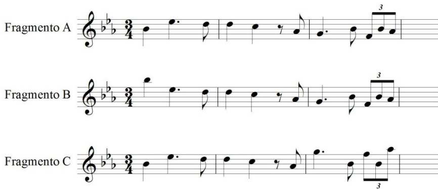
Figura 1. Tres fragmentos melódicos basados en la misma escala, el mismo vector de clases de intervalos, orden, y distribución de clases de alturas. Fragmento A: tomado del Op. 89-XVI de Schubert, y utilizado como estímulo en Autor (2013b). Fragmento B: versión distorsionada de A donde la dispersión local es similar pero la dispersión global aumenta. Fragmento C: versión distorsionada de A donde la dispersión local aumenta pero la dispersión global es similar.

Con todo, el modelo de Longuet-Higgins y Steedman (1971) tiene una estricta dependencia de la noción de “escala”, lo que limita su potencial. Efectivamente, para la década de 1980 la idea propia de la Teoría Musical de que “tonalidad” es sinónimo de “escala” había sido absorbida de un modo bastante acrítico por la Psicología de la Música (al respecto, ver Brown y Butler, 1981). El problema de esta idea es que conlleva la presunción de que la escala (como entidad) es la unidad de análisis de la tonalidad. Al respecto, nótese por ejemplo que si se eliminaran las notas lab del Fragmento A de la Figura 1, la “claridad” tonal del mismo se vería más afectada que si se removiese la nota mib , aun cuando mib es la tónica: esto porque, al eliminar el lab , las notas restantes sugieren un mayor número de posibles tonalidades/escalas de referencia; en especial, sugieren la escala de Sib mayor, que por la “regla de la primera nota” pasaría a ser la tonalidad del fragmento. En cambio, al eliminar el mib la única escala de referencia posible es aún la de Mib mayor. Esta situación paradójica nos lleva a la conclusión de que no todas las notas de la escala comunican el mismo monto de información tonal, conclusión que le es ajena al modelo de Longuet-Higgins y Steedman—que toma como unidad de análisis tonal a las escalas, en vez de sus notas. Este tipo de razonamiento llevó a H. Brown y D. Butler a formular un modelo funcional y dinámico de inducción tonal.