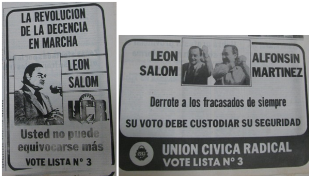
FIGURAS 1 Y 2 Propaganda de campaña del Radicalismo en la prensa