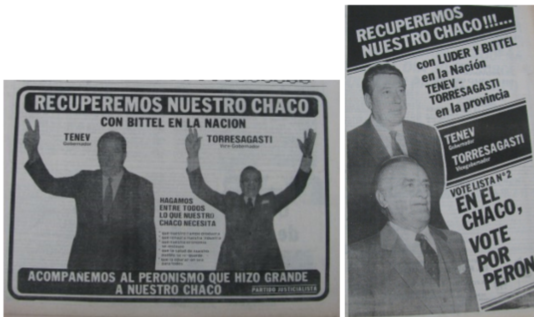
FIGURAS 3 Y 4 Propaganda de campaña del Justicialismo en la prensa