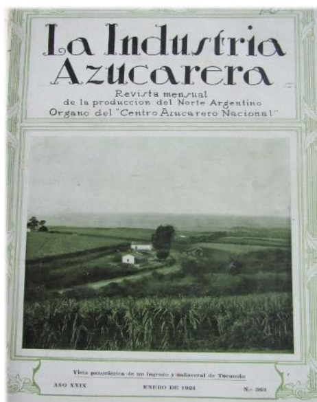
Figura 2 – Vista panorâmica de um engenho e canal de Tucumán

Fonte: Centro Azucarero Argentino (1924).