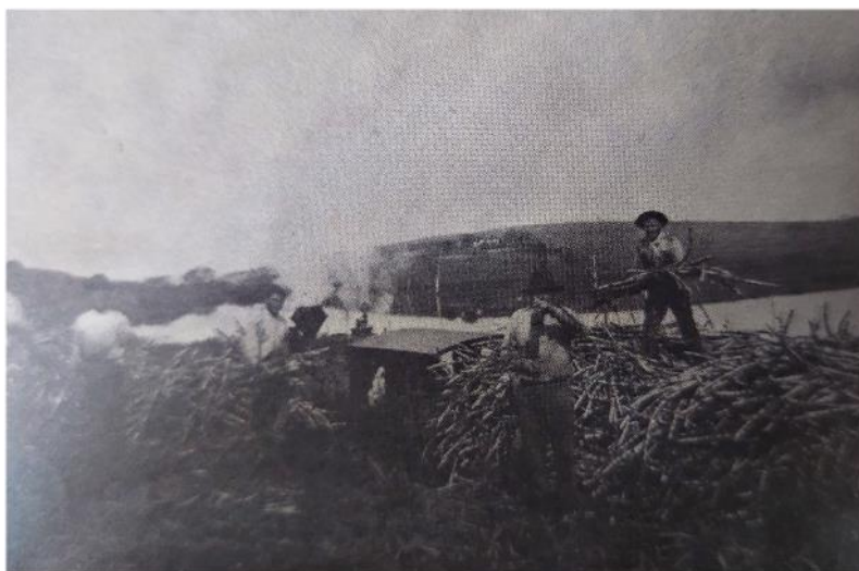
Figura 1 – Embarque de cana em vagões. Ao fundo, o Rio Piracicaba

um problema em comum. 23 Além da maior facilidade de transporte do açúcar para os centros consumidores, as ferrovias auxiliaram a suprir a crescente demanda de matéria-prima dos modernos maquinários. Como escreve Picard (1996, p. 33), as vias férreas podiam ser comparadas “às patas de uma aranha”, estendendo-se do ponto central da fábrica até atingir os canaviais. Além das ferrovias próprias, algumas usinas, como a de Piracicaba, podiam se aproveitar das ferrovias estaduais, como a via férrea da Companhia Ituana, podendo buscar canas a 20 quilômetros de distância. Importa lembrar que um dos principais problemas enfrentados pelos engenhos centrais no período do Império foi a falta de matéria-prima (Brandão Sobrinho, 1903). Nesse particular, as fotografias do período (Figura 1) destacam o uso das ferrovias para transporte da cana no estado de São Paulo. 24