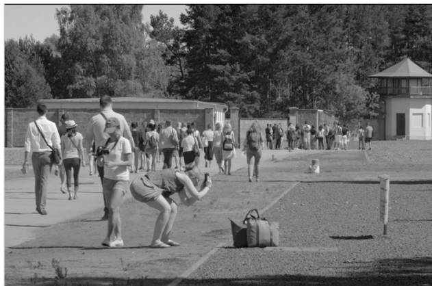
Figura 5 Austerlitz

Austerlitz lleva adelante una estrategia similar, solo que en forma más radical, con la cámara quieta, con planos de mayor duración y una fotografía en blanco y negro. Esta observación minimalista sobre los antiguos campos —también devenidos en memoriales— de Sachsenhausen y Dachau, ambos ubicados en Alemania, registra a los diversos contingentes de turistas, encontrando situaciones similares (Figura 5) que en el documental de Bloomstein. De este modo, los campos de concentración se han vuelto en la actualidad en espacios recreativos, donde la masa de contingentes pasea despreocupada —e incluso indiferente— bajo un clima de complacencia (Figura 6). Con un título que remite a la obra de W. G. Sebald, la potencia de la película radica en su banda sonora, o mejor dicho en la atmósfera sonora que crea, que produce en el espectador la sensación de que se encuentra inmerso en la visita. Los campos ahora están llenos de ruido, de bullicio, lo que crea una sensación de agobio. Esto queda resaltado por la impresión que da la película de que el turista es como un invasor, solo que, en vez de llevar armas de fuego, trae un arsenal de cámaras. En la observación de Loznitsa los visitantes no se conmueven, al contrario, parecen felices de hallarse en frente a un horno crematorio y poder obtener así su foto junto a este.