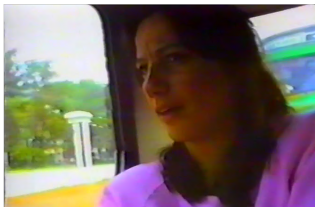
Figura 10 Desaparición forzada de personas