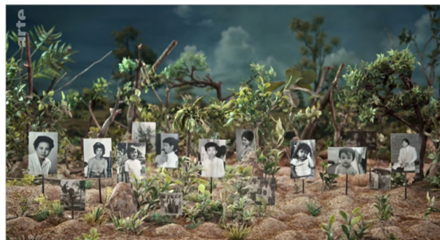
Figura 19 Les tombeaux sans noms