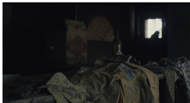
Figura 13 Dubina dva

En ningún momento Glavonic apela a entrevistas o imágenes de archivo, los testimonios son en off sin ninguna corporalidad en cuadro. Recién al concluir, con los créditos finales, comprendemos que muchos de los testimoniantes pidieron permanecer anónimos y que otros testimonios fueron grabados en diversos juicios en el marco del Tribunal Penal Internacional para la antigua Yugoslavia. De este modo, los testigos narran las razones que desencadenaron la masacre y lo que ocurrió en la pizzería, espacio que resultó ser el epicentro de la masacre. Con las huellas todavía marcadas en las paredes, Dubina dva logra traer el pasado al presente, y con la atención puesta en los detalles, las ruinas del espacio cobran otro sentido, activando así la imaginación del espectador. De este modo, ese espacio abandonado deja de ser un espacio yermo para dimensionar en consecuencia la masacre allí ocurrida (Figuras 13-16).