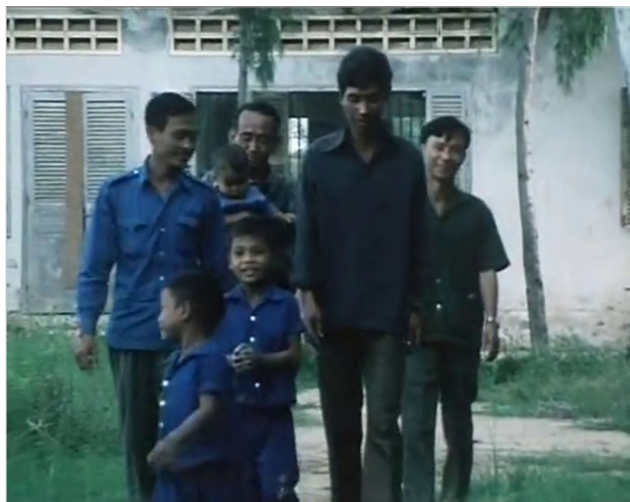
Figura 1 Year Zero: The Silent Death of Cambodia