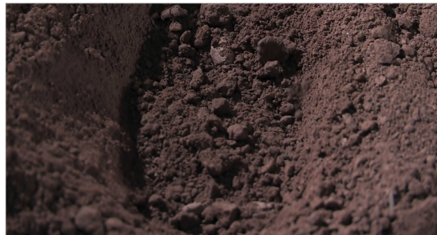
Figura 18 L'image manquante

una tumba (Figura 18). No son, desde ya, las “verdaderas” tumbas, sino que Panh logra crear un espacio simbólico para dar sepultura a las víctimas y, en cierto sentido, efectuar un duelo. Una línea narrativa de Les tombeaux sans noms sigue ese camino apelando en algunas secuencias a los dioramas; de este modo, en un viaje espiritual, Panh explora diversos espacios en Camboya buscando las posibles tumbas de sus familiares sin dar con ellas. Para dar cuenta de un espacio abstracto, la película, entonces, se vuelve un espacio simbólico (Figura 19) con el fin de dar sepultura a sus parientes, y aquí, a diferencia de la película anterior, veremos fotos de todos ellos a modo de lápidas. Así, en el largo recorrido hecho por Panh en su filmografía, donde ha desarrollado una sensibilidad singular en su forma de abordar el genocidio camboyano, en sus últimas obras, más personales que las primeras, ha logrado desplegar una potencia simbólica singular, empujando las fronteras de la representación cinematográfica de los genocidios.