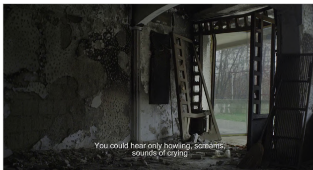
Figura 16 Dubina dva