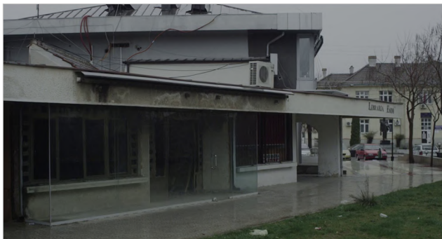
Figura 14 Dubina dva