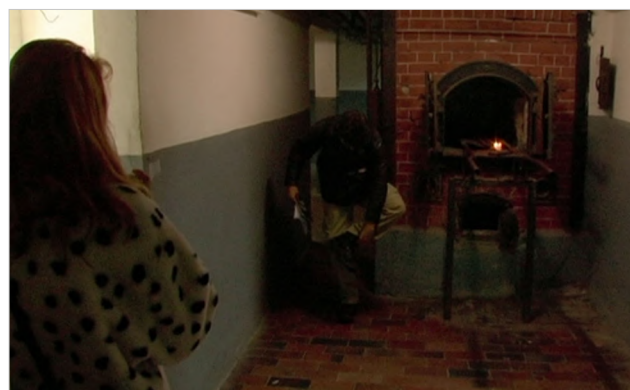
Figura 4 KZ