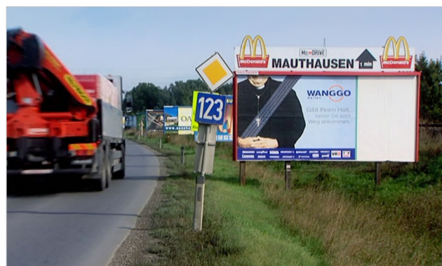
Figura 3 KZ

Aunque Bloomstein no interviene en forma corporal, su posición –no necesariamente crítica pero sí como una manifestación de contradicciones– se hace presente en la imagen. Sirven como ejemplo dos tomas donde emergen dichas paradojas: el cartel de McDonald’s Mauthausen (Figura 3) y la preparación de un turista para sacarse una foto –su pareja le pide que se arregle los pantalones para posar correctamente– al lado de un horno crematorio (Figura 4). De este modo, en tanto