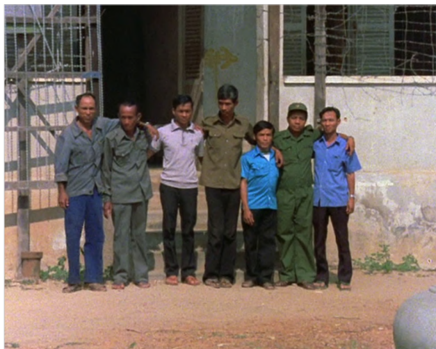
Figura 2 Die Angkar