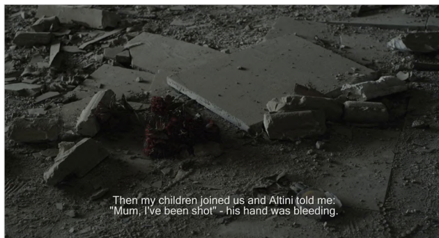
Figura 15 Dubina dva