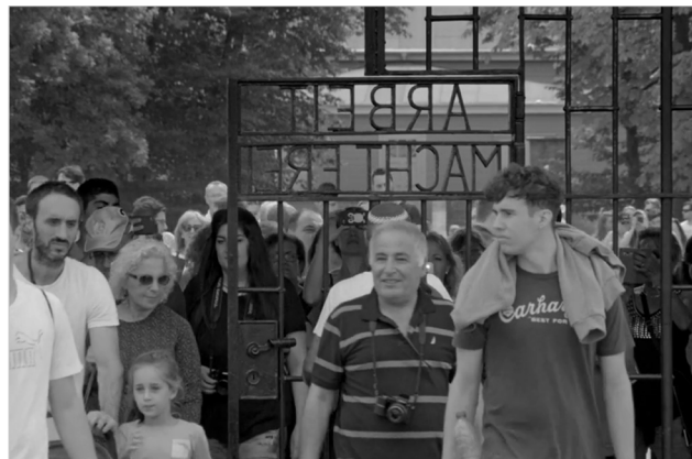
Figura 6 Austerlitz