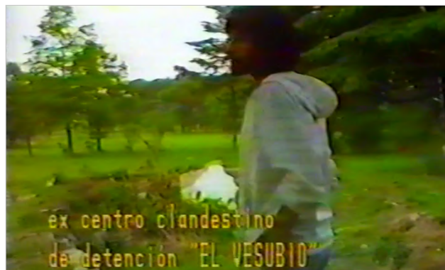
Figura 9 Desaparición forzada de personas

Con todo, el retorno al espacio de exterminio no es exclusivo del sobreviviente. En documentales como S21, la machine de mort khmère rouge o en el díptico sobre Indonesia The Act of Killing (Joshua Oppenheimer, 2012) y The Look of Silence (Joshua Oppenheimer, 2014) son los victimarios los que regresan a los espacios. Sin embargo, existen diferencias en las producciones: mientras que en la de Panh el S-21 es el epicentro, en las de Oppenheimer los espacios no son centrales, sino que su propósito radica en exponer el genocidio y la impunidad del crimen. De este modo, la estrategia de Panh en su película es crear el marco para que la memoria –tanto declarativa como corporal– de un grupo de antiguos guardias e interrogadores pueda fluir y generar extensos testimonios sobre el funcionamiento cotidiano del centro de interrogación y tortura. En las diversas salas y antiguas celdas, los victimarios dan cuenta del pasado de aquel espacio, escrutando sus recuerdos, analizando documentos y también gestualizando las acciones corporales que antaño hacían. En ocasiones, para ayudar a los victimarios a evocar el pasado, estos se reúnen con el