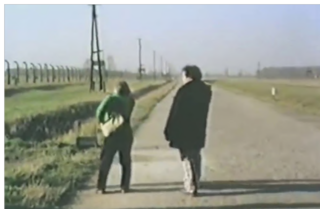
Figura 8 Kitty: Return to Auschwitz