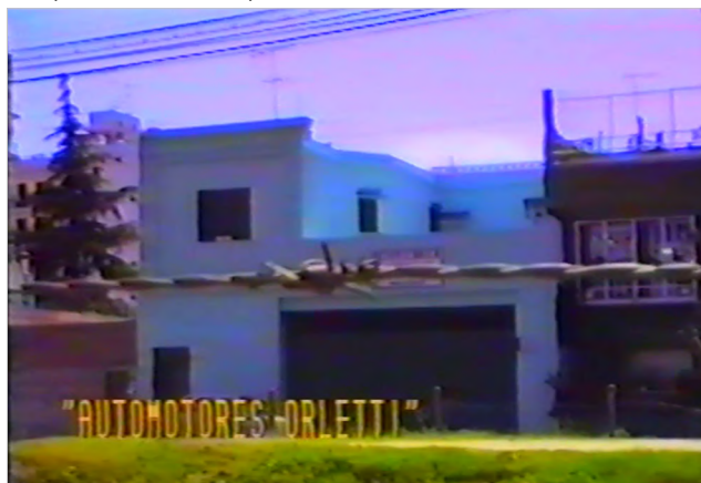
Figura 12 Desaparición forzada de personas