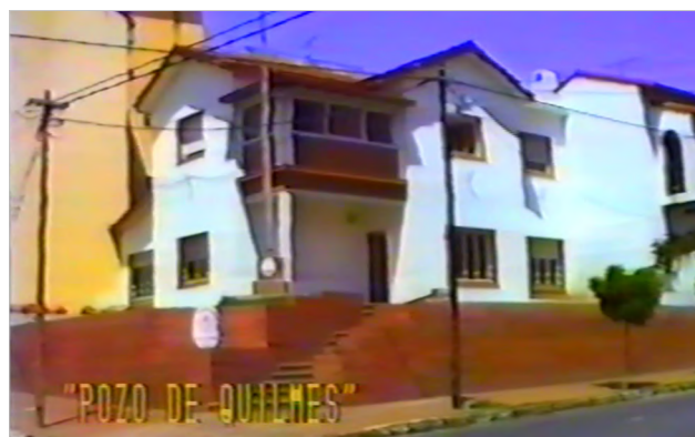
Figura 11 Desaparición forzada de personas