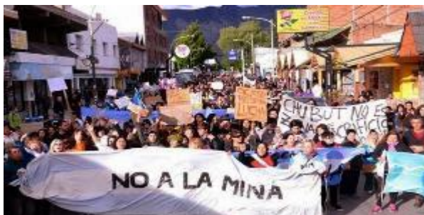
Imagen 2: Manifestación “No a la mina”