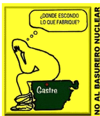
Imagen 1: panfleto del MACH