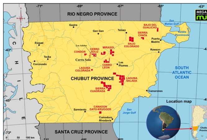
Mapa 2 : Localidad de Gastre y Esquel, provincia de Chubut, Argentina