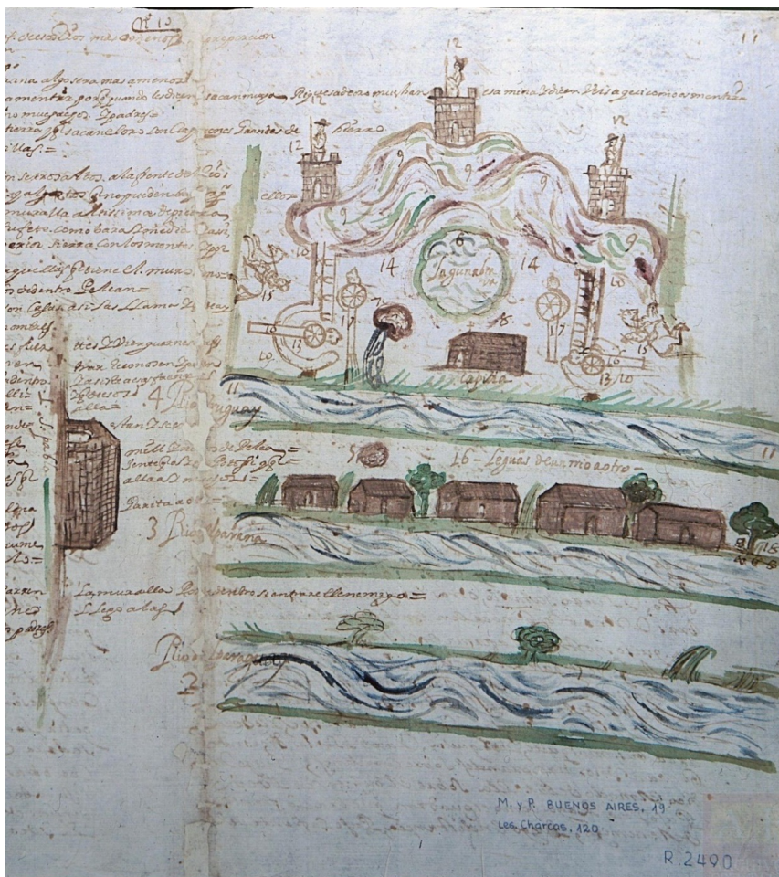
Figura 2: Mapa de las minas de oro de los jesuitas