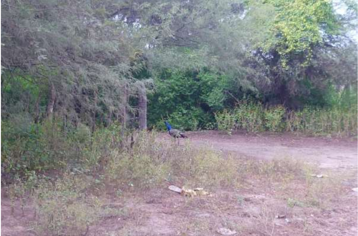
Figura 1: El monte nativo y un pavo real en el paraje Santo Domingo, Cruz del Eje (Córdoba)