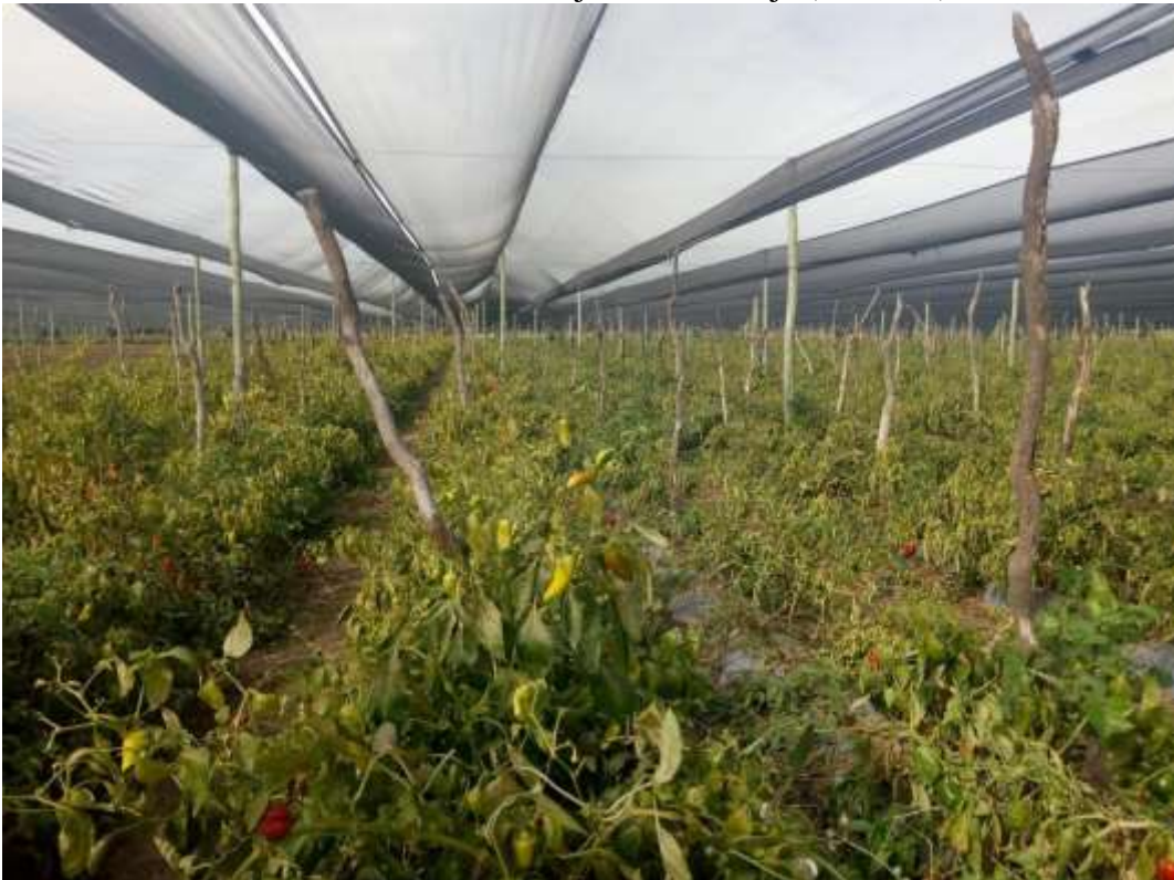
Figura 3: Invernadero de hortalizas con malla antigranizo de pequeños productores en la comuna de Media Naranja, Cruz del Eje (Córdoba)