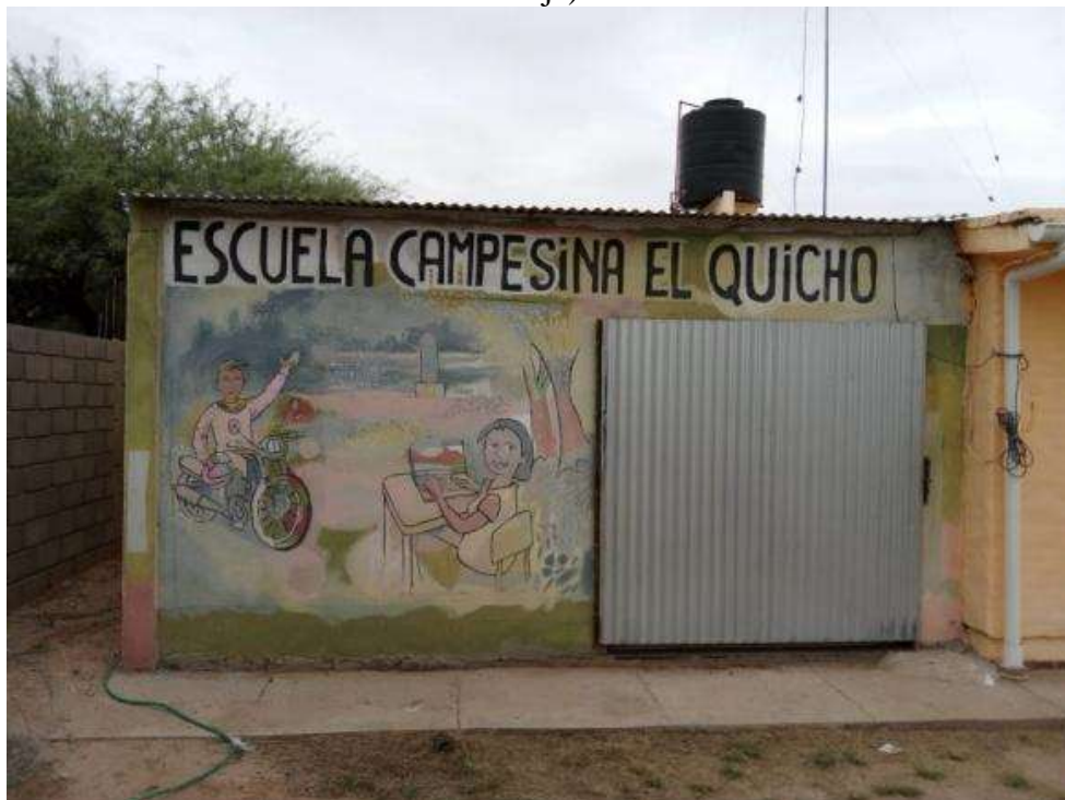
Figura 4: Escuela Campesina Ruben Dario en El Quicho, Serrezuela (Cruz del Eje)