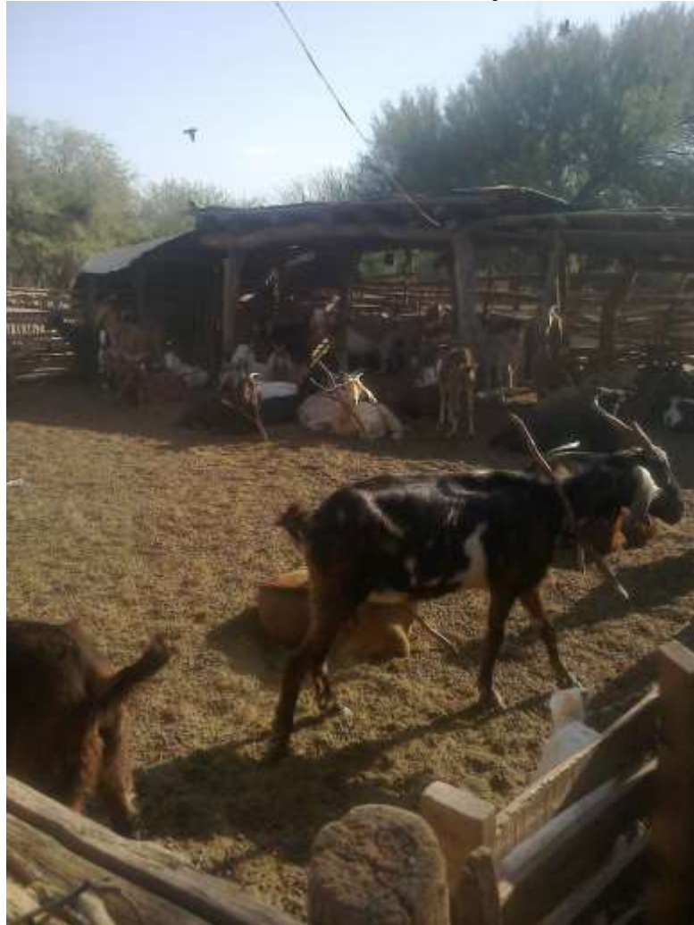
Figura 2: Curral de cabras de una familia campesina en la comuna de Guanaco Muerto, Cruz del Eje (Córdoba)