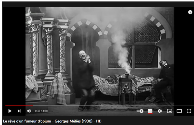
Figura 1: Fotogramas de Le rêve d'un fumeur d'opium (1908)