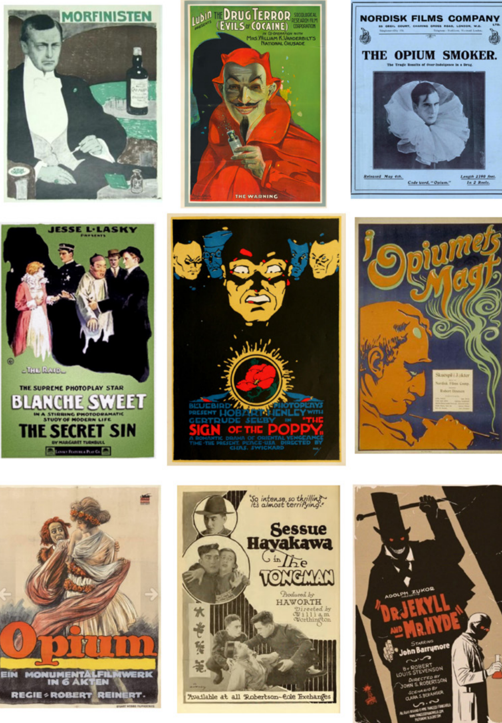
Figura 2: Carteles publicitarios de época

Nota: En orden descendente y de izquierda a derecha: Morfinisten (1911), Drug terror (1914), Opiumsdrømmen (1914), The secret sin (1915), The sign of the poppy (1916), I Opiumets magt (1918), Opium (1919), The tongman (1919) y Dr. Jekyll and Mr. Hyde (1920).