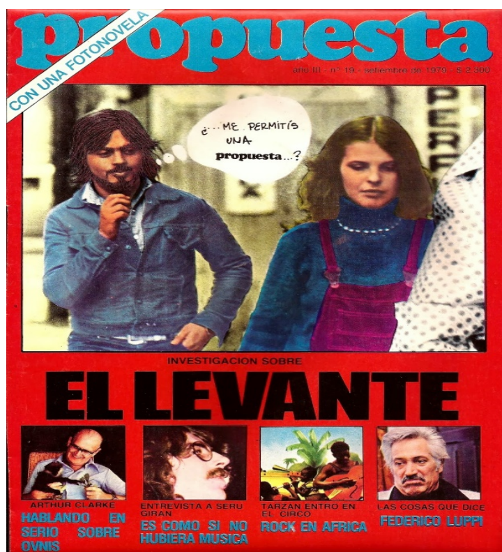
Propuesta , Año III, N° 19, septiembre 1979