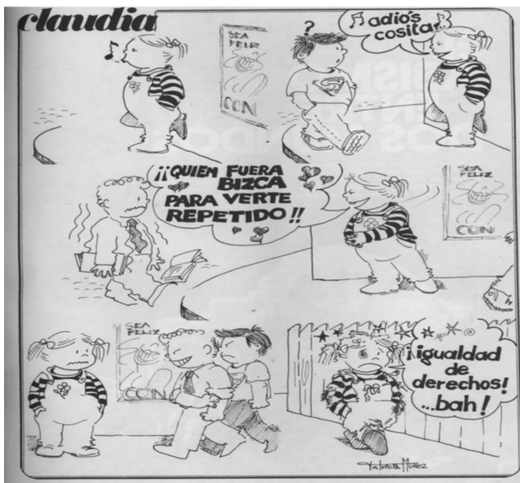
Todas , Año II, N° 3, 1980, p. 25.

daban cuenta de conflictos específicos y coyunturales que afectaban a las mujeres como, por ejemplo, la problemática del gremio bancario y, específicamente, el cierre del BIR. 48 Así, Todas acabó por entroncar con una línea de intervención asimilable al tenor que la organización le imprimió a otro tipo de iniciativas tales como los boletines sindicales o el periódico partidario lo que, puede esgrimirse, correspondió también a un viraje en la política más general del partido en lo relativo a las mujeres y al diálogo con los feminismos.