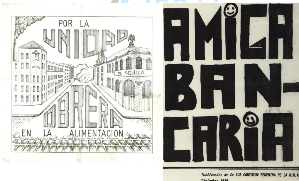
Boletines Por la Unidad Obrera en la Alimentación (1977) y Amiga Bancaria (1979)

Este tipo de tácticas le permitió a la militancia identificar individualmente a diversas mujeres factibles de profundizar el lazo más allá de lo recreativo, lo que redundó en otro tipo de construcción como la gestación de comisiones femeninas en diversas entidades, la incorporación a la organización de activistas particulares o la participación organizada en conflictos como el ya mencionado cierre del BIR. 30