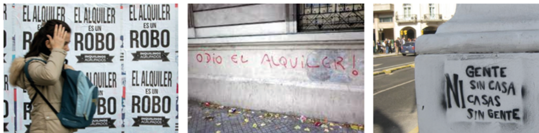
Figura 1. Afiches y graffiti callejeros haciendo referencia a la vivienda en alquiler y la escasez de la vivienda asequible en Buenos Aires y Rosario, Argentina, 2020-2022