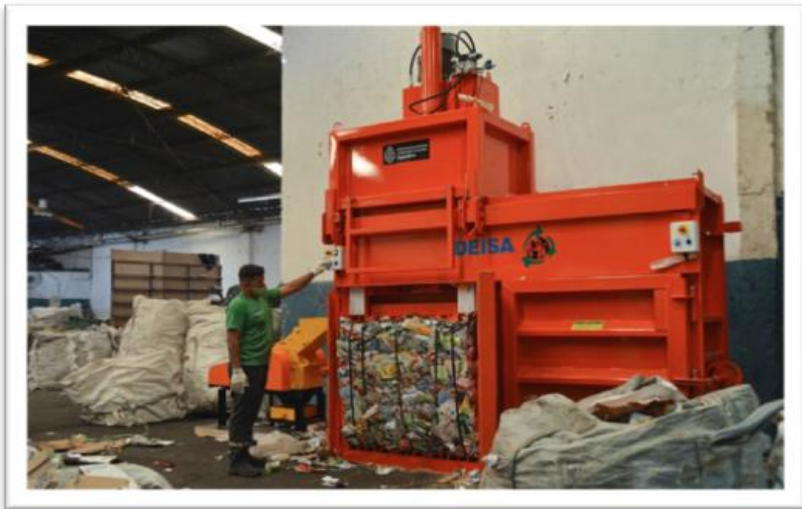
Figura 6. Recuperador de residuos operando una prensa.

trabajar erguidos; es decir, no tener que agacharse a clasificar los residuos desde el suelo; la prensa o enfardadora, que les permite compactar los residuos clasificados en forma de fados (ver figura N° 5), operación que les permite a las organizaciones obtener mayor ganancia al venderlo ya que el precio del material compactado es mayor al no compactado; la agrumadora, que es una máquina que sirve para triturar el plástico. Este proceso dota de mayor valor al material al venderlo, ya que las empresas recicladoras compran el plástico triturado para producir nuevos envases. Si el plástico no está triturado, las empresas deben hacer ese proceso y les lleva tiempo y costos (Verón, 2021). El proceso de tecnificación de los trabajadores de la recuperación de residuos es la muestra de cómo los residuos son elementos de trabajo para buena parte de la población de José León Suárez.