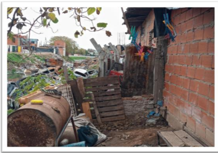
Figura 2. Patio de una vivienda ubicada al borde del "Zanjón".

De modo que residuos como plásticos, cartones o maderas son utilizados para levantarlas paredes de las viviendas. Suele ocurrir que con el paso del tiempo éstas se van ampliando en paralelo con la llegada de hijos/as y nietos/as a las familias, y se van reemplazando aquellos materiales más frágiles por cemento y ladrillos. Si bien Rafaela y Carmen nos hablan de sus hogares años atrás, actualmente una gran cantidad de viviendas en los barrios están construidas con residuos, especialmente, las que se fueron emplazando en los últimos años y que se ubican en los bordes del zanjón, próximas a los terrenos de la CEAMSE y de basurales clandestinos.