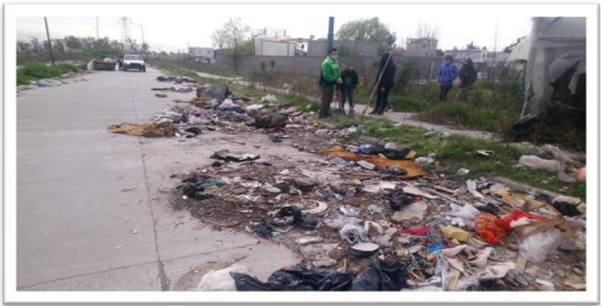
Figura 3. Microbasural en unos de los barrios de José León Suárez.