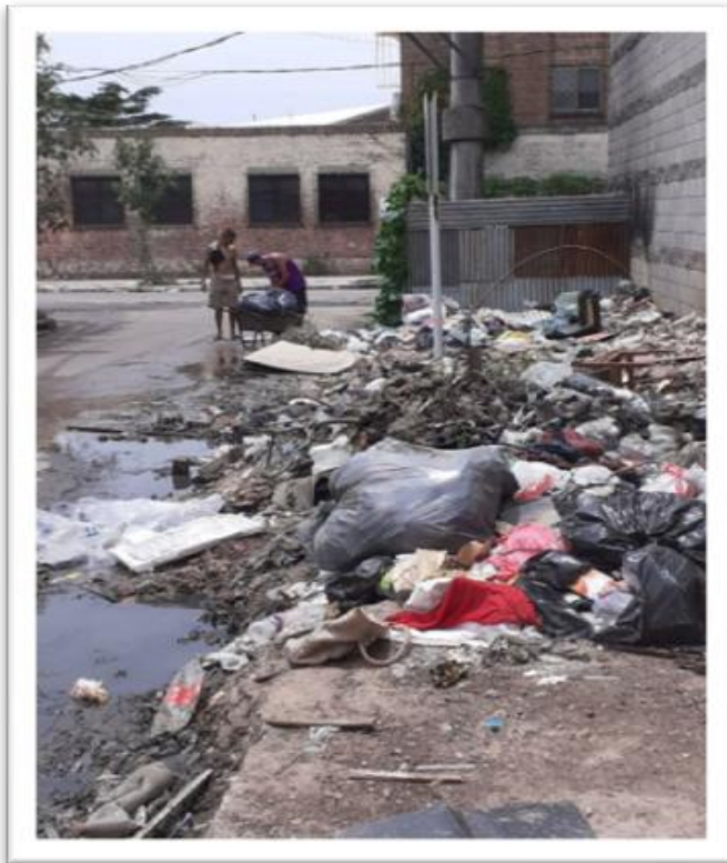
Figura 4. Microbasural en uno de los barrios de José León Suárez.

En este sentido, entre la intermitencia en el servicio de recolección y la presencia de ratas, los/as vecino/as encuentran en el zanjón el lugar de disposición final de sus desechos. Ello recupera los viejos tratamientos urbanos de los residuos que narran la imagen de la quema, la pelea con el municipio tanto por los restos domiciliarios como por aquellos que corren por las aguas o los basurales clandestinos, como se puede observar en las figuras 3 y 4.