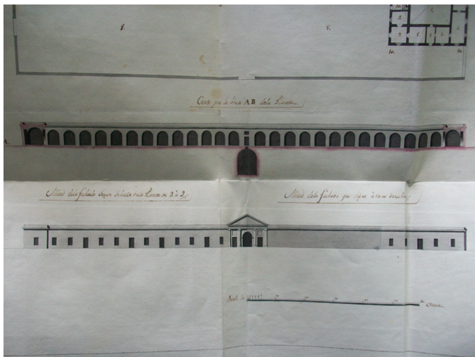
Figura n° 2. Plano del cementerio de Buenos Aires, proyectado en 1810 (detalle de la fachada). 83

La Junta volvió a reunirse dos veces más durante los meses de enero y febrero de 1810. Elegida la ubicación en una quinta del Alto de San Pedro, los funcionarios dispusieron que se procediese a levantar los planos para la construcción de un cementerio de 150 varas de frente por 300 de fondo. Además de los cuartos para los capellanes, sacristán y sirvientes, el ambicioso proyecto contemplaba una capilla, un pórtico, un osario y un extenso muro con “dos órdenes de nichos” y un “angelorio”. 82 La fachada principal –de sobrio estilo neoclásico– reflejaba en sus líneas rectas y depuradas los principales rasgos del nuevo gusto ilustrado (figura n° 2). El plano y el presupuesto –que ascendía a la exorbitante suma de 99.000 pesos– fueron remitidos al virrey Cisneros el 5 de mayo de 1810. Tan sólo una semana más tarde, se conocía en Buenos Aires la noticia de la caída de la Junta de Sevilla, y con ella daba inicio una sucesión de complots e intrigas que habrían de terminar en la destitución del fugaz virrey.