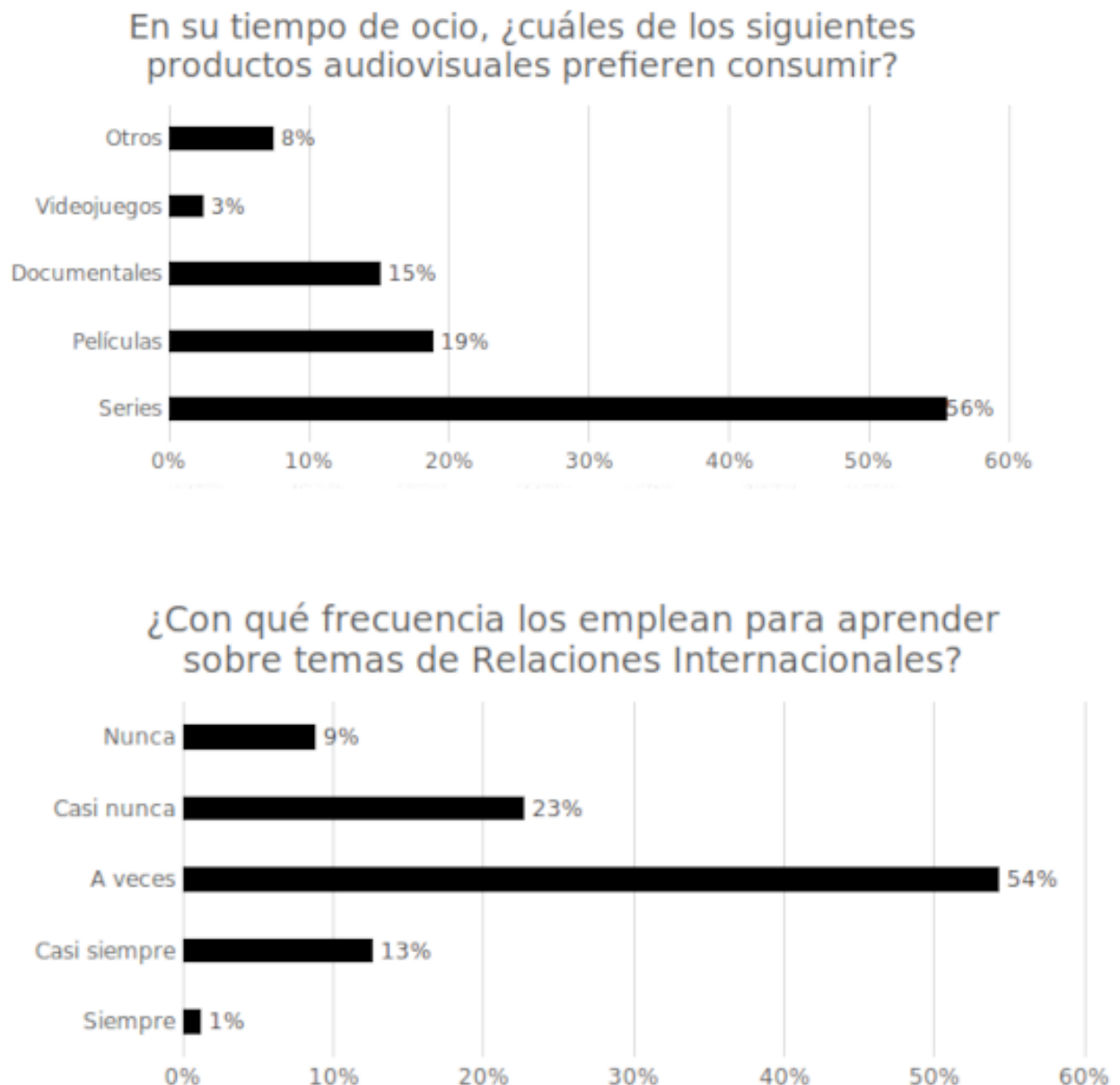
FIGURA 1: RESPUESTA SOBRE EL CONSUMO DE ARTEFACTOS CULTURALES AUDIOVISUALES

La encuesta consultó también a los estudiantes su grado de acuerdo con la frase “Las series de ficción de productoras y/o directores del Norte Global (principalmente Estados