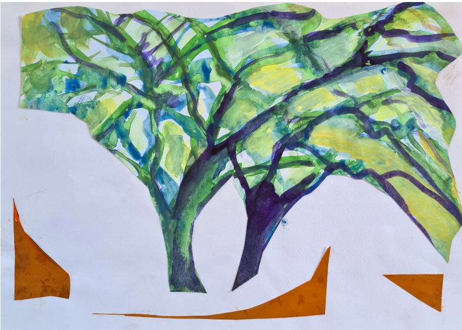
Paisaje pampeano , tinta y acrílico sobre papel. Ana María Martín

También hay lugar para las acciones y las pasiones en la intra-acción barrioescuela. Esto es, retomando la serie analítica “la quema-te re-quema”, nos referimos a un lugar que no deja de construirse entre la quema, entre las cuerdas de barrioescuela y donde los/as docentes, muchas veces, se queman en esa afección. Sin embargo, se está en lucha, siempre, aun quemados/as porque, si bien los/as profesores/as no son vehículos todoterreno, como nos decía Lidia, igual la remamos, la seguimos, la contamos .