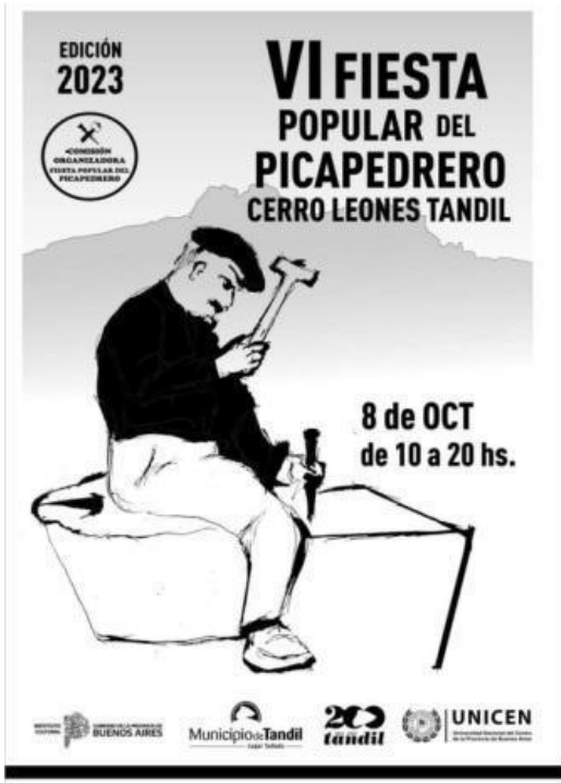
Imagen 3: Flyer de promoción de la Fiesta del Picapedrero. Tandil. (Agenda culturayespectaculos.com, 2023)