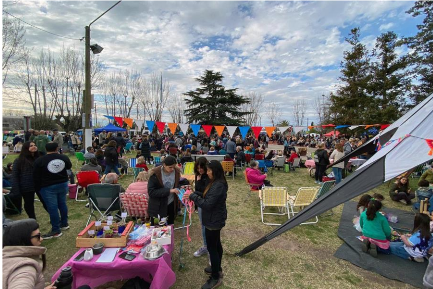
Imagen 5: Primera edición de la Fiesta de la Torta Frita- Loma Negra- Olavarría (Municipio de Olavarría, 2023)