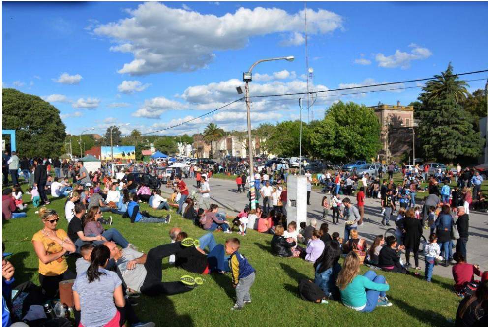
Imagen 4: Fiesta del Choripán Serrano. Sierras Bayas. (Municipio de Olavarría, 2019)