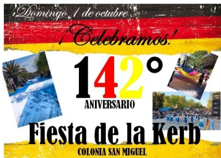
Imagen 1: Flyer de promoción de la Fiesta de la Kerb en Colonia San Miguel. (Facebook -Colonia San Miguel, 2023)