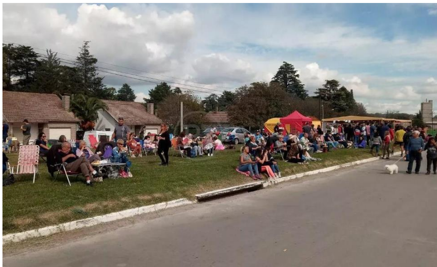
Imagen 6: Primera edición de la Fiesta de la Bondiola en Sierras Bayas.

En las imágenes 4, 5 y 6 puede advertirse el protagonismo de las reposeras situadas en parques, bulevares y veredas. Las fiestas se desarrollan en las avenidas o calles principales de los poblados. En el caso de las localidades serranas y mineras del partido de Olavarría, pueden apreciarse las fábricas cementeras y caleras como figuras de fondo (ver imagen 6).