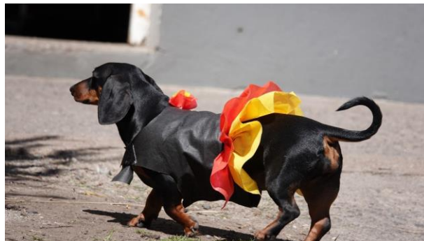
Imagen 8: Decoraciones alusivas en el marco de la Fiesta de la Kerb en Colonia San Miguel. 2023.