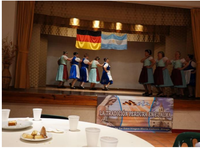
Imagen 7: Bailes tradicionales realizados en el marco de la Fiesta de la Kerb en Colonia Hinojo. Foto: Silvia Boggi, 2023.