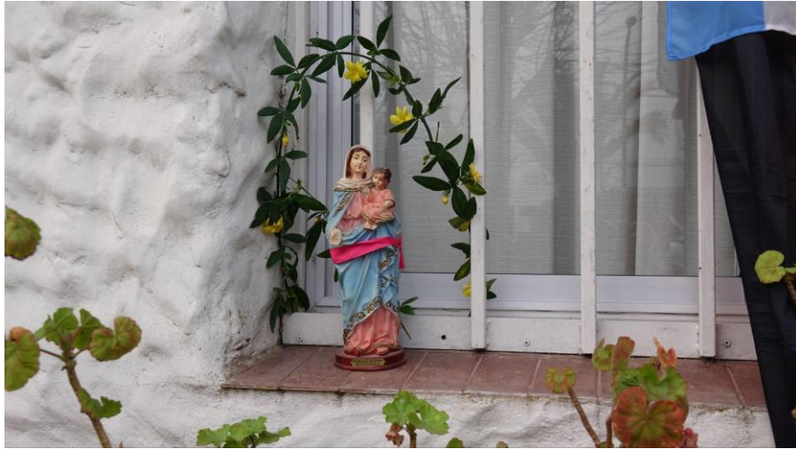
Imagen 9: Decoraciones alusivas en las casas de Colonia Hinojo, en el marco de la Fiesta de la Kerb. Foto: Silvia Boggi. 2023.