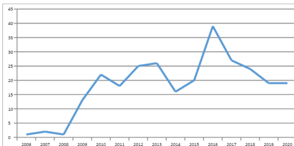
Gráfico 1: Conflictos laborales en Tandil durante 2006-2020

Fuente: base de conflictos laborales del MTEySS