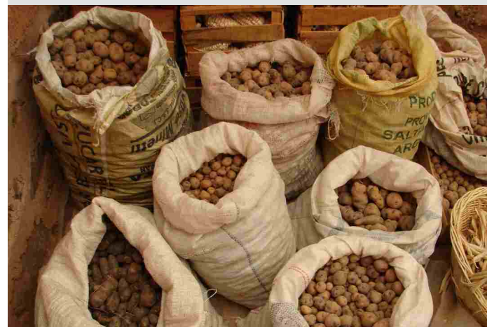
► Papas (DT)