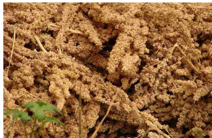
► Quinua (DT)

CNA: Censo Nacional Agropecuario 2002. De aquí surgen los últimos datos disponibles para la región de Quebrada. Si bien en 2018 se realizó un nuevo censo agropecuario, los resultados aún son preliminares y no hay datos disponibles por departamentos.