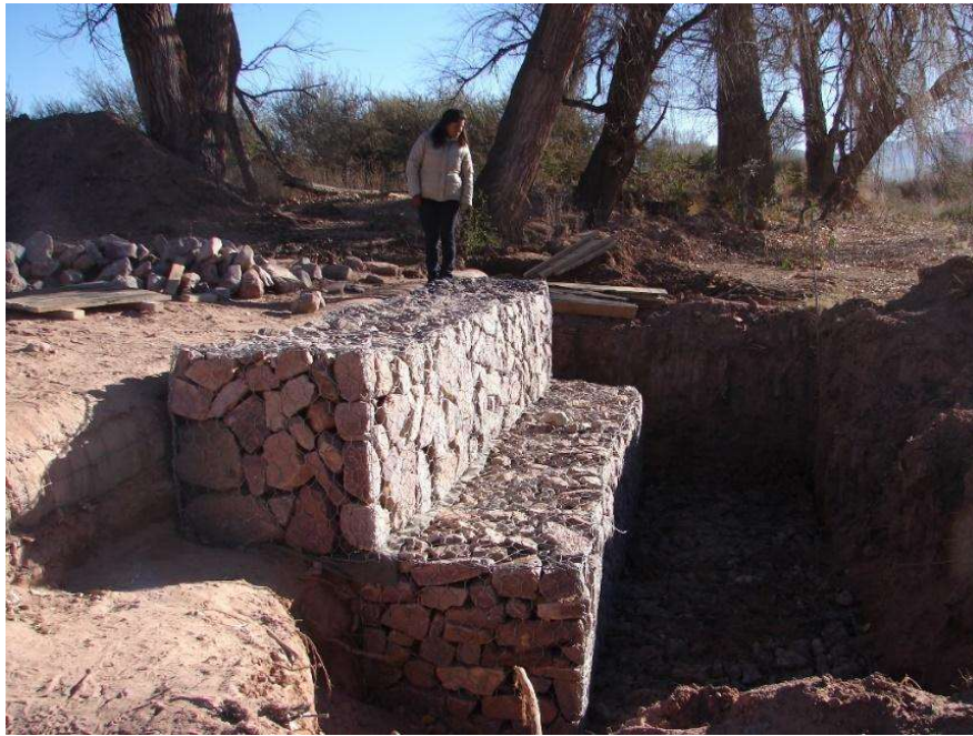
Figura 4. Defensas de gaviones en San Roque, 2012 (dto. Humahuaca).

Otra técnica para la construcción de defensas utilizada en la actualidad y también en el pasado es la forestación anual en los márgenes de los ríos, tal como relata un agricultor de Ocumazo: