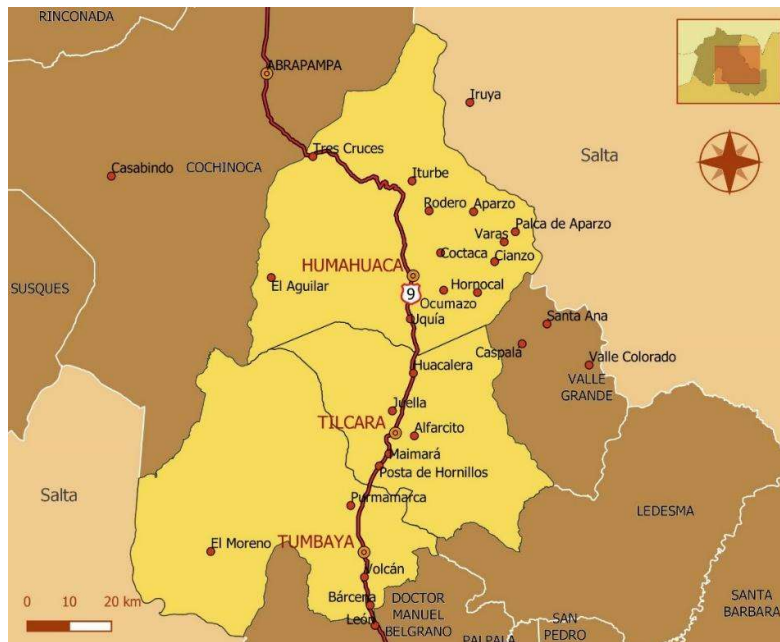
Figura 1. Mapa político de la Quebrada de Humahuaca.

Tumbaya (Fig. 1). El aumento de población entre 1980 y 2022 fue del 46%, crecimiento menor al registrado en la provincia de Jujuy (+98%) que alcanzaba en 2022 los 811.611 habitantes (Instituto Nacional de Estadísticas y Censos - INDEC).