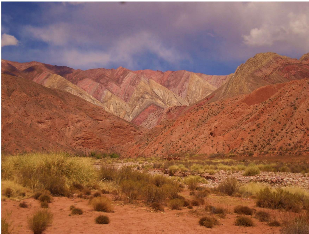
Figura 3. Localidad de Hornocal (dto. Humahuaca). 4

las heladas...el cambio climático, las heladas, las granizas así, eso no... no tenemos los misiles como tienen los tabacaleros, no tenemos ni para prevenir ni las heladas, ni el granizo, no tenemos. Por el tema del clima. El clima y eso es lo que nos afecta, que estamos... tenemos que estar... jugar a la de Dios, que no nos castigue, eso es (Productor 5, Hornocal, Fig.3).