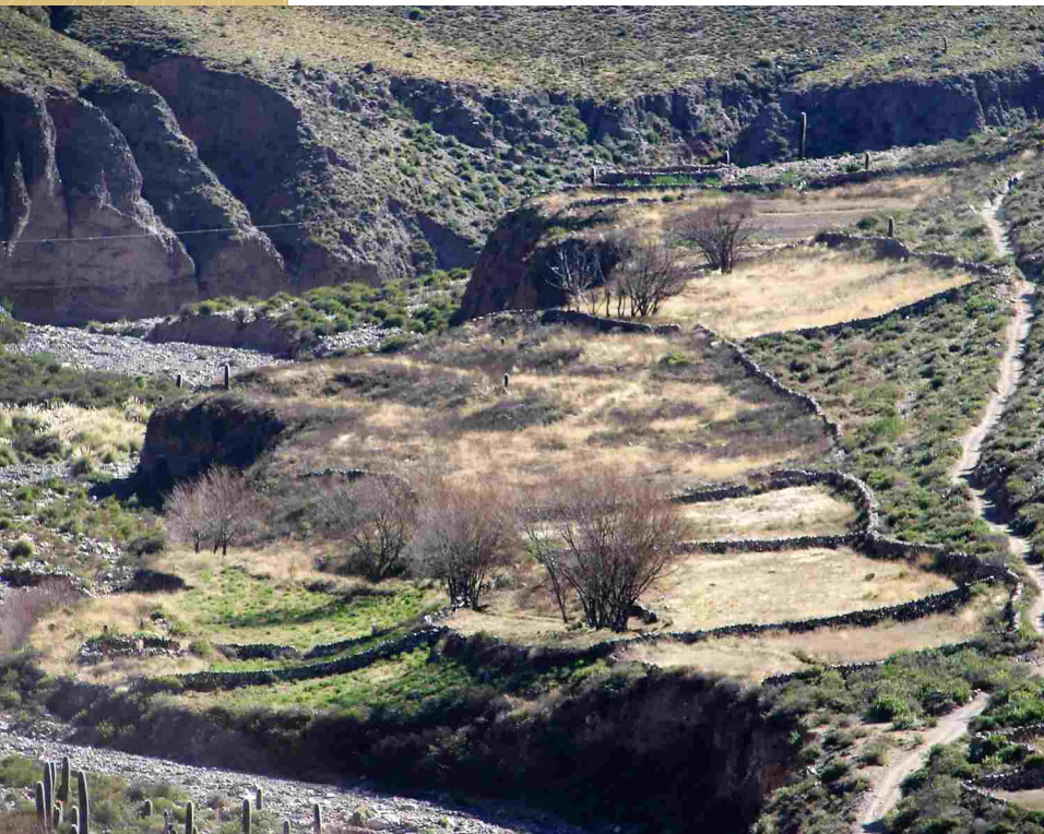
► Rastrojos y corrales camino a Punta Corral (DT)

En las zonas altas prevalecen cultivos autóctonos, algunas variedades de verduras para el consumo doméstico y sólo los excedentes se destinan al mercado. Cuentan con mayor autonomía para el abastecimiento de los insumos básicos como semillas y abono, y se practica la elaboración de “remedios” caseros para combatir plagas y pestes. La cría de ovejas y cabras, y en menor medida ganado vacuno, impulsan también la siembra de pasturas. (DT)