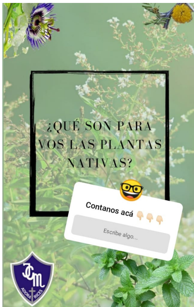
Uno de los flyers para difundir en Instagram y recolectar información a partir de las funciones “encuesta” y “caja de preguntas” que ofrece la plataforma. Elaborados en colaboración con el alumnado y docentes del ISFD