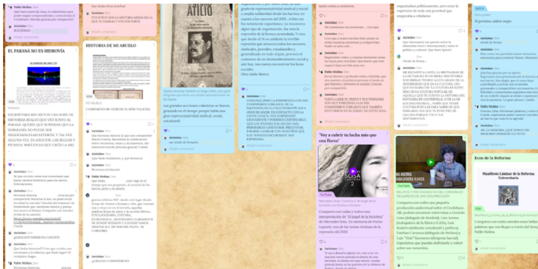
Imagen N° 4. Parte inferior del collage colectivo “Córdoba en acción”. La imagen se encuentra editada para resguardar la identidad de los cursantes.

Parte de este diálogo quedó plasmado en el collage colectivo, herramienta que, a su vez, nos permitió evaluar el proceso del cursado. Dado su formato interactivo, que posibilita linkear y comentar las publicaciones , el Padlet permitió una nueva instancia de diálogo e intercambios.