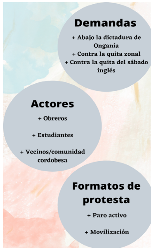
Imagen N° 2. Recurso utilizado en el tercer encuentro de Córdoba en Acción. Tuvo como finalidad trabajar con el Cordobazo en relación con la noción de acción colectiva de protesta.

Desde este nuevo punto de partida, recuperamos los aportes que realizaron quienes cursaron en el último segmento del encuentro anterior. El soporte escogido fue el de burbujas que exponían en forma de categorías los testimonios que aportaron las y los cursantes vinculándolos con la noción de acción colectiva (ver imagen N° 2).