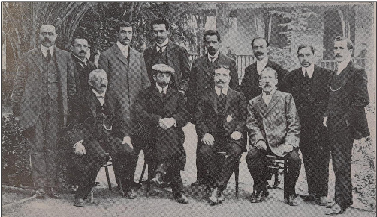
Imagen 1. Plantel docente de la Escuela Nacional de Vitivinicultura y de su Estación Enológica (1911).

En efecto, Alazraqui se presentó en diversos congresos, con ponencias y conferencias donde difundió las principales investigaciones de la institución. Por ejemplo, en 1911, participó en el Congreso Científico Internacional Americano (Buenos Aires). También representó a la Estación Enológica y al país en el Congreso de Vitivinicultura de Montpellier (1911), una de las principales reuniones científicas sobre la materia. Estas participaciones alentaron que sus colegas tomaran igual camino y difundieran la actividad de la institución en diversos congresos; a la vez que dan cuenta de un incipiente proceso de circulación e intercambio de ideas con países con sólida tradición vitivinícola. Adicionalmente, alternó la actividad de técnico estatal con la dirección de diversas bodegas y colaboraciones en distintas revistas y boletines de circulación provincial y nacional, y asesoramientos para el MAN. En particular, la notable recepción del técnico en el medio local se puede corroborar, también, por su participación periódica en la revista técnica Viticultura Práctica , editada por una dependencia técnica del gobierno de Mendoza. Esos escritos describían los numerosos ensayos que dirigió al frente de la Estación y resaltaban la necesidad de vincular la enseñanza práctica con las producciones locales.