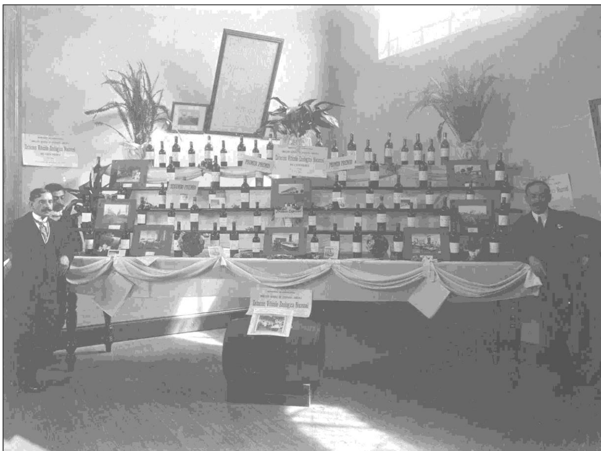
Imagen 2. Exposición vitivinícola (ca.1914-1915).