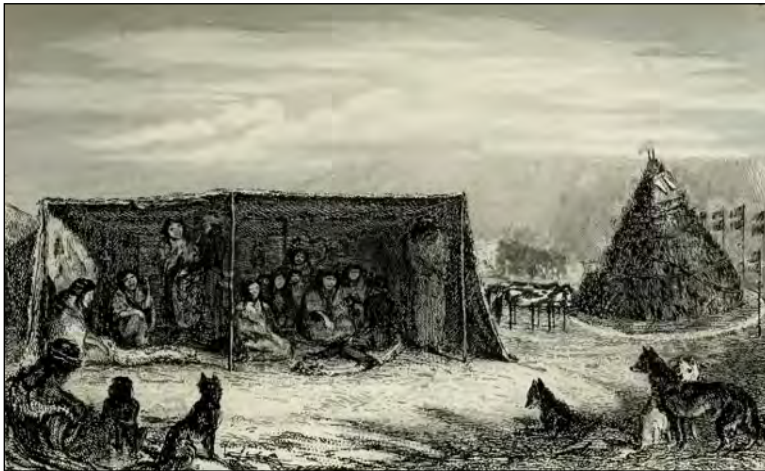
Figura 2. Toldería junto a una estructura de entierro de ramas tipo "choza cónica", con banderines y cueros de caballo montados sobre palos en Bahía Gregorio en 1827 (Fitz-Roy, [1826-1827]1839, p. 94).