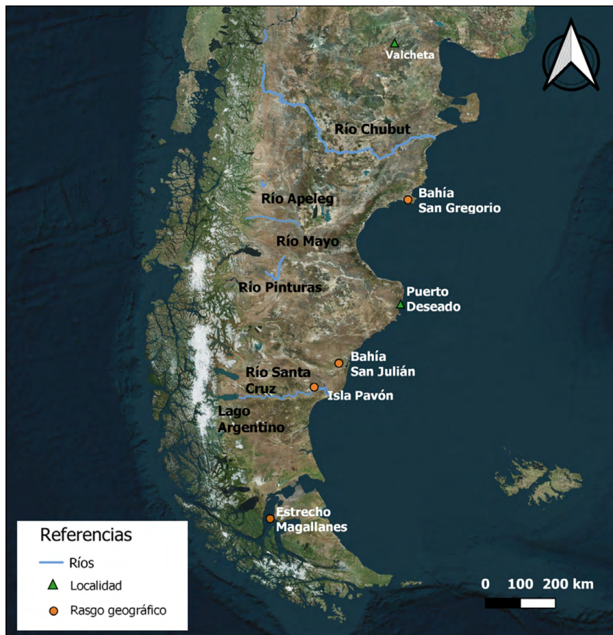
Figura 1. Mapa de la región analizada indicando los principales rasgos geográficos, ríos y localidades mencionadas en las fuentes.

Se utilizaron todas las fuentes editadas del período comprendido entre los primeros contactos con sociedades europeas (inicios del siglo XVI) hasta la primera mitad del siglo XX. Se priorizaron aquellas con mayor confiabilidad, utilizando como criterio que se trate de relatos de primera mano resultantes del contacto directo con grupos indígenas (Rodríguez y Delrio, 2000). Sin embargo, existe un conjunto de fuentes en las cuales no resulta del todo claro definir si la información proviene del contacto directo o de relatos de terceros (e.g. Falkner, [1744-1751]1911 1 fue incluido y contrastado con los relatos de mayor confiabilidad). La región analizada comprende la Patagonia central y meridional, entre el río Chubut y el Estrecho de Magallanes (Figura 1), al este de la Cordillera de los Andes. No obstante, se incorporaron datos provenientes de