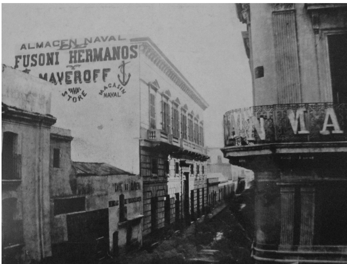
Imagen 2: Almacén de Fusoni y Maveroff, Buenos Aires, ca. 1870

Fuente: La calle Cangallo tomada desde la esquina San Martín, en dirección oeste. Fotografías sobre papel. Autor desconocido, ca. 1870. Colección particular, citado en D’Onofrio, 1944, p. 33.