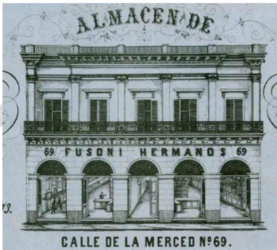
Imagen 1: Sello de la casa Fusoni Hermanos, Buenos Aires, 1858