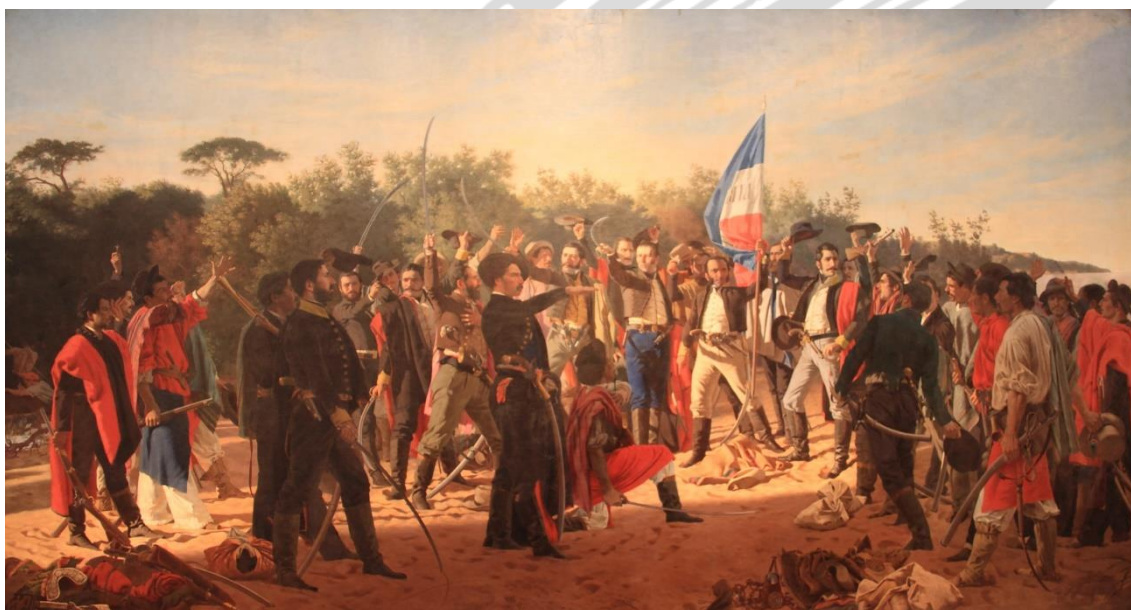
Imagen 6: El juramento de los treinta y tres orientales (1878)

Fuente: Juan Manuel Blanes, El juramento de los treinta y tres orientales (1878), óleo s/ lienzo, 311 x 564 cm. Museo de Bellas Artes Juan Manuel Blanes, Montevideo, Uruguay.