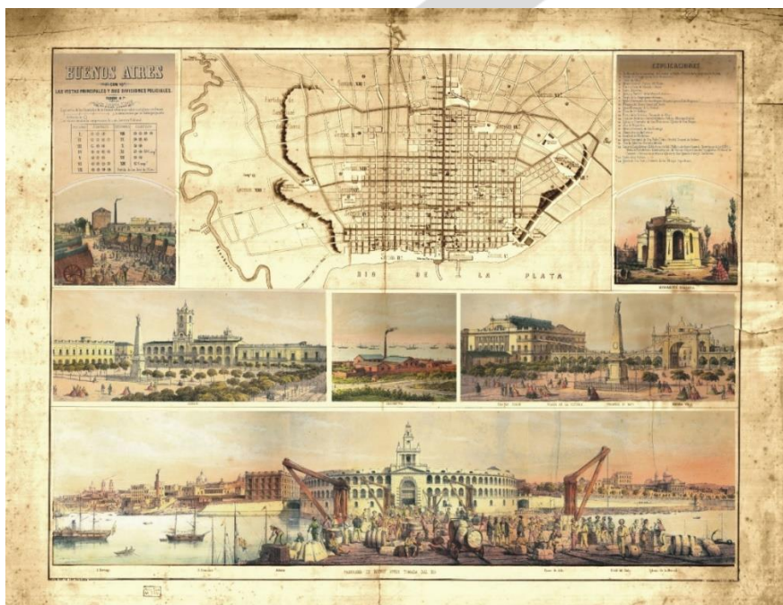
Imagen 7: Plano de Buenos Aires con detalles de sus vistas principales, 1859