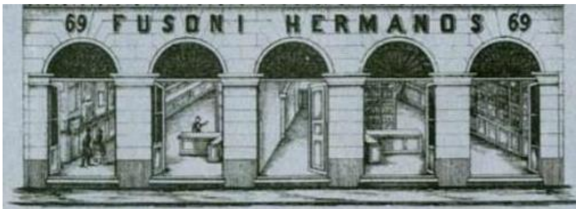
Imagen 3: Detalle del Sello de la casa Fusoni Hermanos, Buenos Aires (1858)