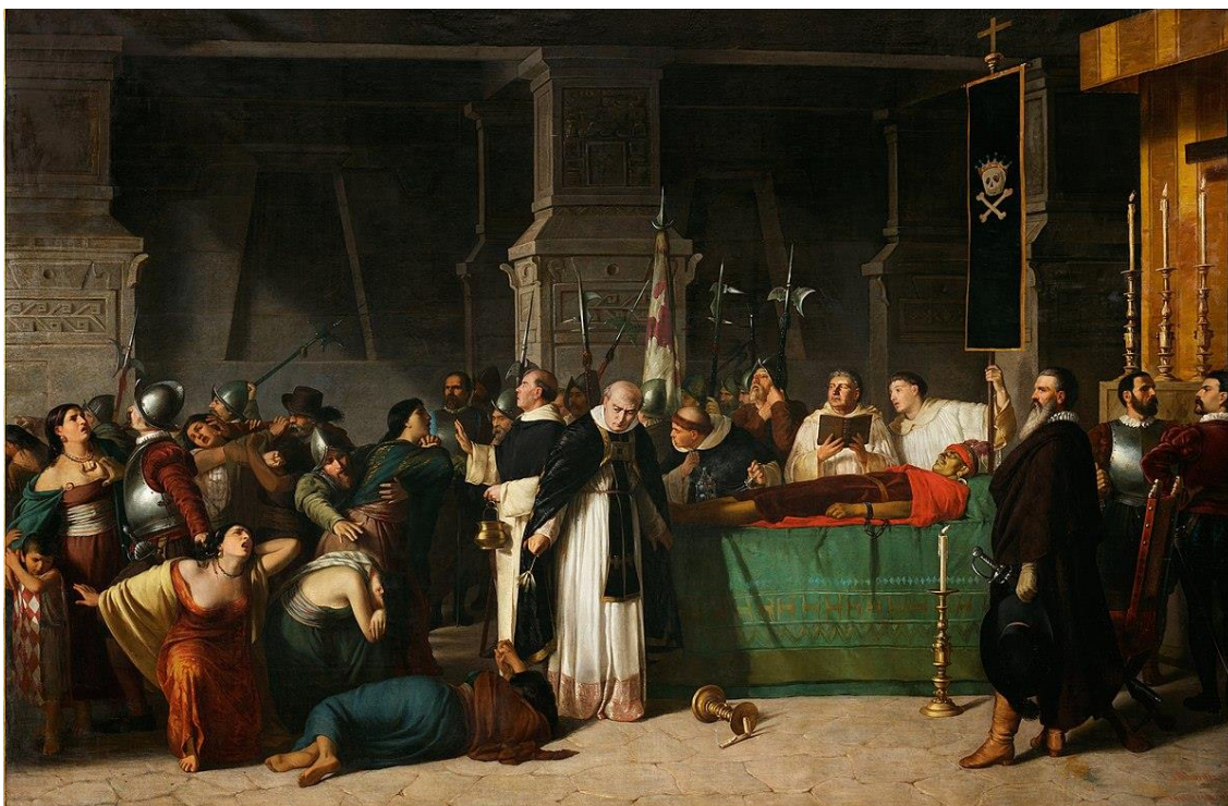
Imagen 5: Los funerales de Atahualpa (1867)

Fuente: Luis Montero, Los funerales de Atahualpa (1867), óleo sobre lienzo, 420 x 600 cm. Museo de Arte de Lima, Perú