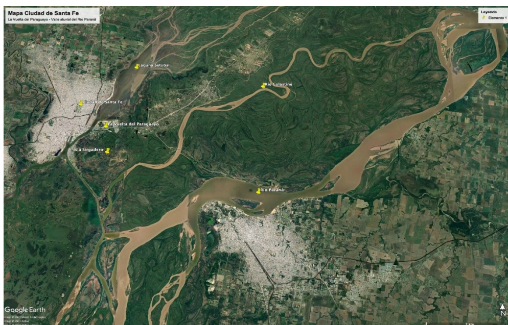
Figura 1. Imagen satelital de marzo de 2023 que muestra LVDP con las aguas del río en su cauce y el valle aluvial del Río Paraná.