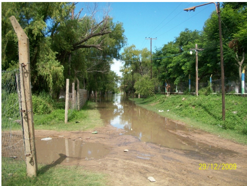
Figura 4. Foto del camino de LVDP en época de inundación.