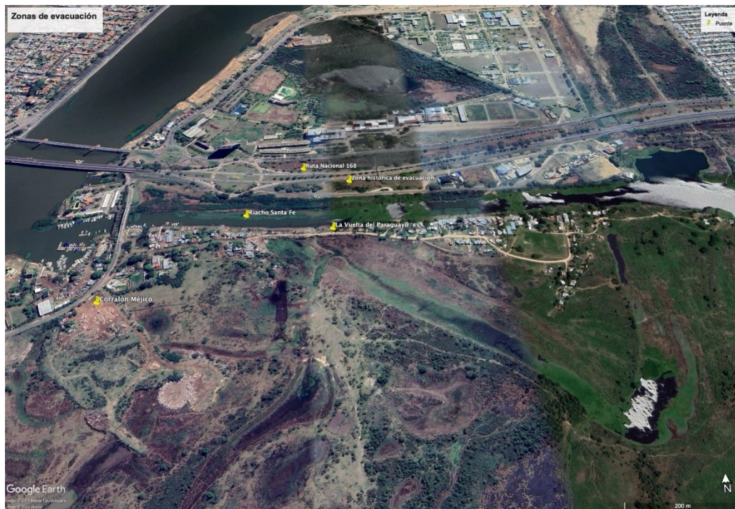
Figura 5. Imagen satelital de marzo de 2023 que muestra las zonas de evacuación de LVDP.

Publicado en Martínez (2023).