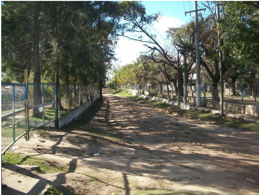
Figura 3. Foto del camino de LVDP cuando no hay inundación.

Fuente: Archivo de Facebook de Proyecto Revuelta. Publicado en Martínez (2023)