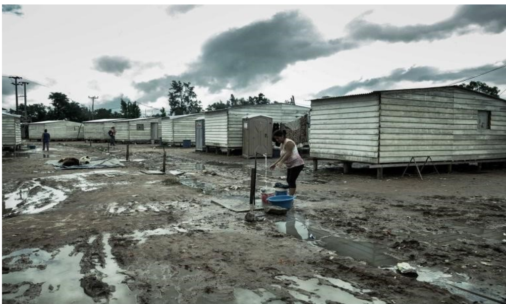
Figura 7. Predio de evacuados en espacio del Corralón Méjico, año 2016.

Publicada en Martínez (2023).