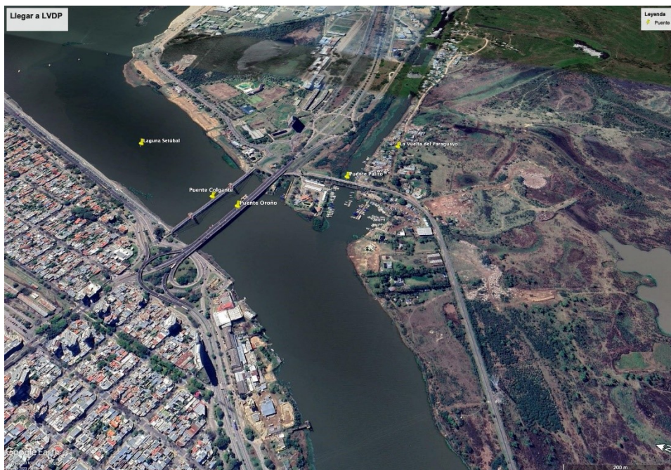
Figura 2. Imagen satelital de marzo de 2023 que muestra los puentes que hay que atravesar para llegar a LVDP.

Fuente: elaboración propia a partir de Google Earth. Publicado en Martínez (2023).