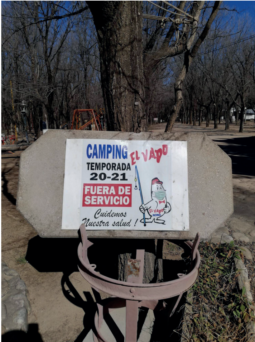
Figura 6: Cartelería de uno de los camping tradicionales del pueblo