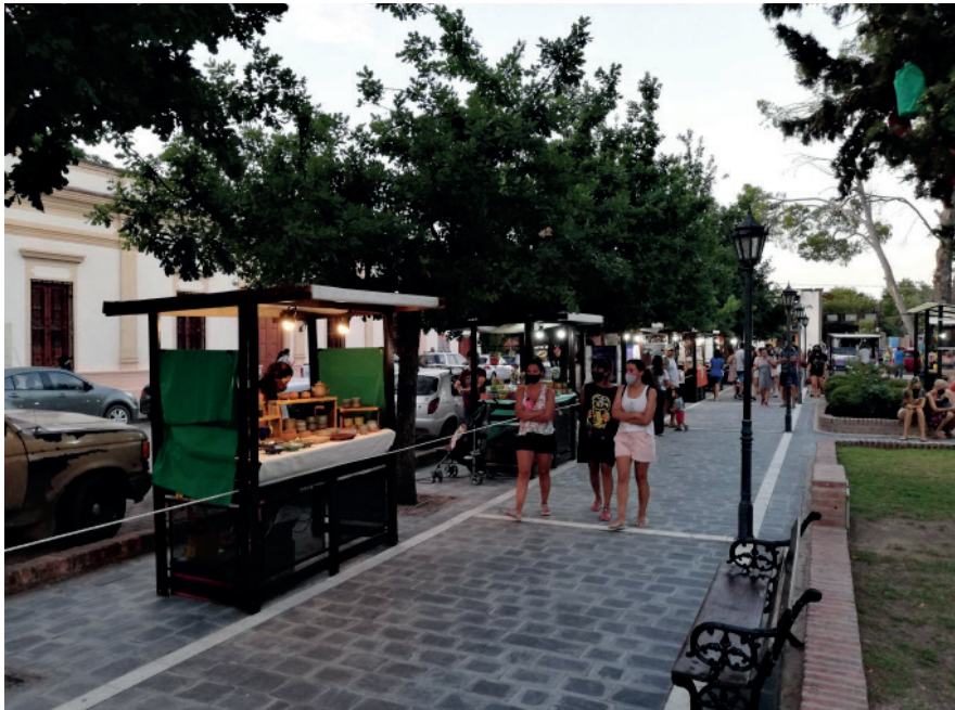
Figura 5: Paseo típico por la Feria de Artesanías y Productos Regionales