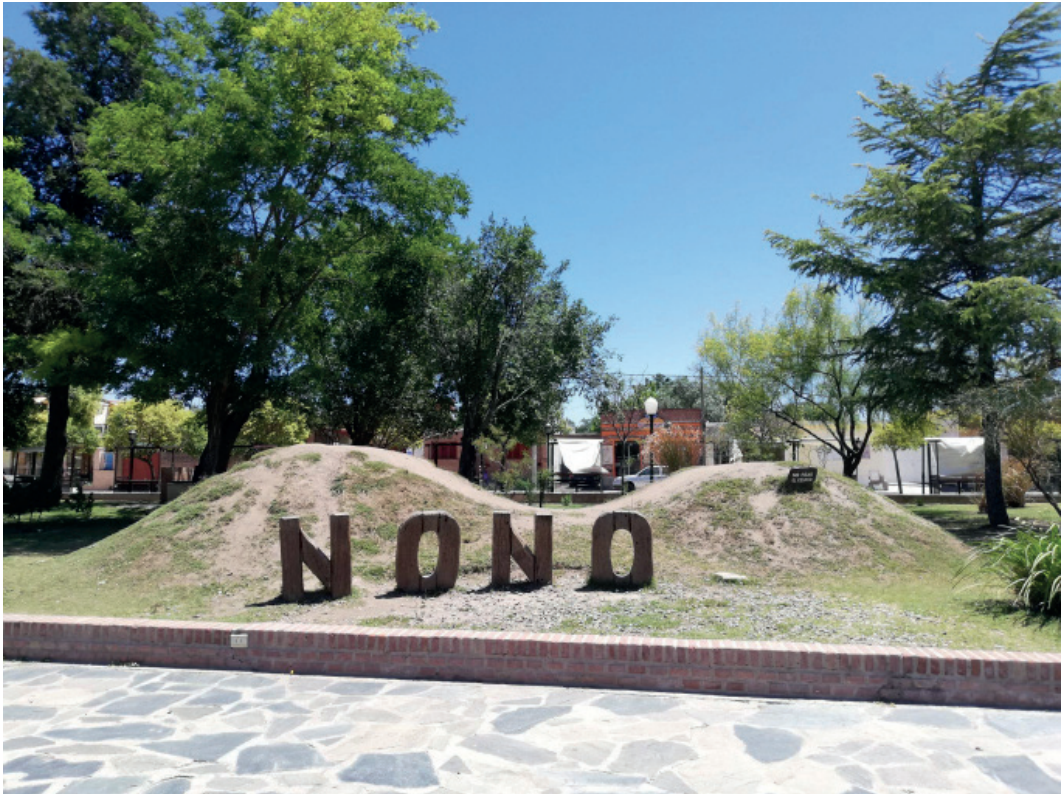
Figura 2: Plaza San Martín de Nono, principal centro turístico del pueblo

lantes” y, dicen, “garantía de entorno antiestrés” que contrasta con el “caos” de la gran ciudad e “invita a dejar atrás la rutina”. La fama histórica de las cualidades terapéuticas del microclima serrano es otro de los atractivos que se utiliza como tópico para convocar a nuevos visitantes. Este se fundamenta en su condición de templado y seco, “320 días de sol al año” y una óptima distribución de oxígeno que se conjuga con la carga energética de los minerales de la zona (granito, uranio, feldespato).