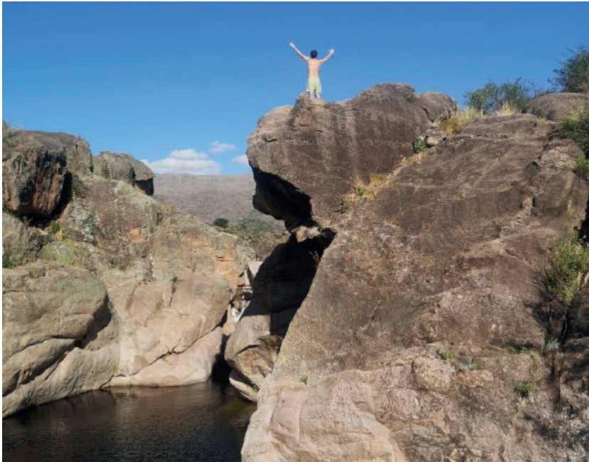
Figura 3: Turista disfrutando del paisaje serrano en el balneario Paso de Las Tropas