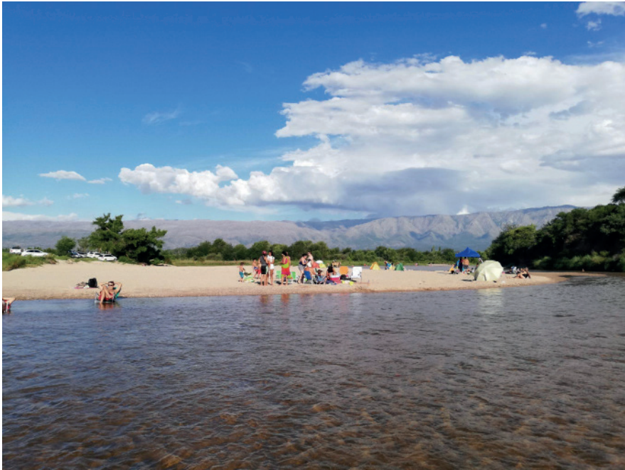
Figura 4: Familias con distanciamiento social en el Río Chico de Nono