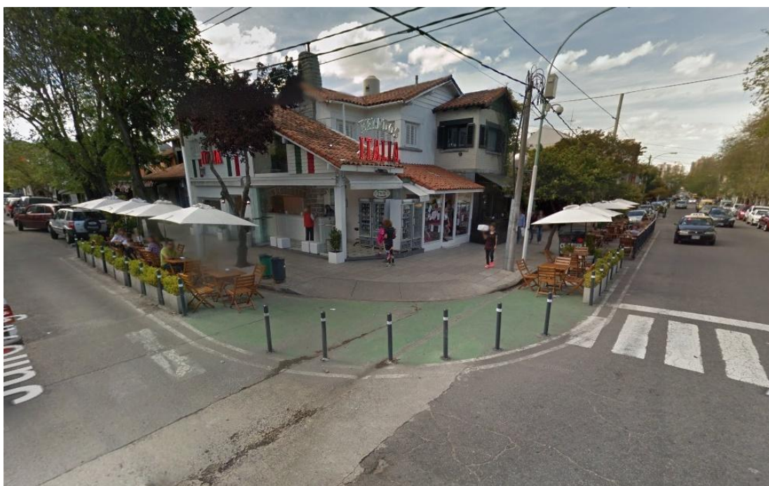
Fig. N°2: “Calles para la gente”. Deck gastronómico. Güemes y Roca