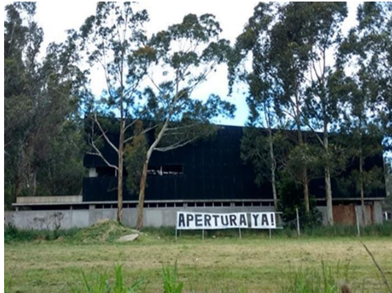
Fig. N°6: Obra sin finalizar, polideportivo barrial Carnet