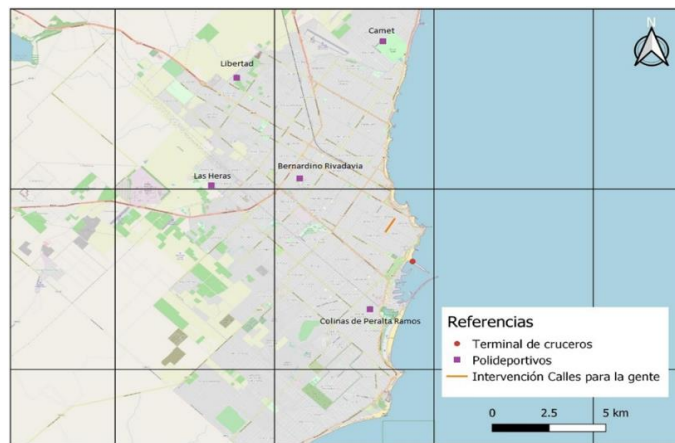
Fig. N° 1: Grandes Intervenciones Urbanas CES-BID