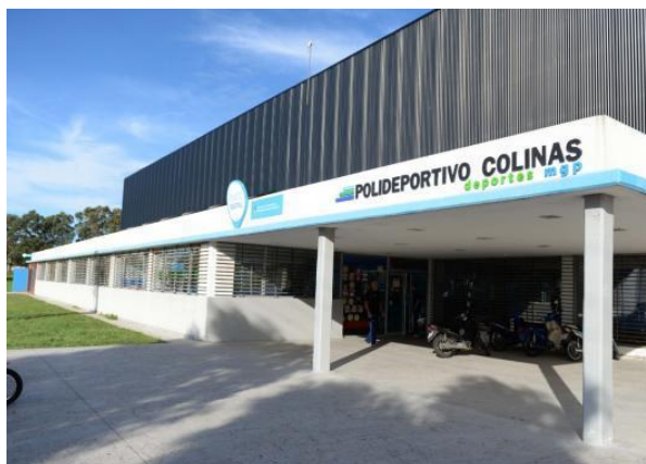
Fig. N°5: Polideportivo Barrial Colinas de Peralta Ramos.

Seguidamente se ahondará en el análisis de dos de estos Polideportivos. En primer lugar, el de Colinas de Peralta Ramos, (Fig. N°5) por ser el de mayor convocatoria y circulación diaria, y, en segundo lugar, el de Camet (Fig. N°6), por las problemáticas y reclamos que se generaron por la falta de finalización de las obras.