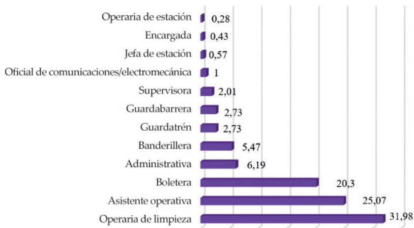
Figura 3. Puestos en los que se desempeñan las mujeres, línea Mitre (porcentajes). Año 2017